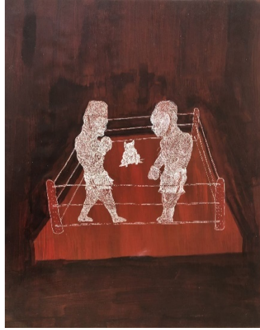
Resim 7. Tayfun Pirselimoglu, Boxing Match, 2024, Mixed media on paper, 63,5 x 51 cm.