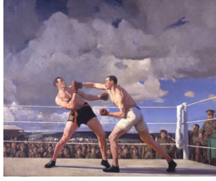
Resim 5. Laura Knight, Boxers , 1919 T.Ü.Y.B. 304x365 cm Kanada Savaş Müzesi https://www.stivesart.info/cornish-artists-and-authors-at-war-1914-9/

Laura Knight, 1918 tarihli Boxers adlı eseri (Resim 5), boksü kadın bakış açısıyla ele alarak sporun sadece erkekler dünyasına ait olmadığını ve evrensel bir sanatsal tema haline gelebileceğini göstermiştir. Ringde dövüşen boksörlerin etrafında askeri kıyafetli izleyiciler; dövüşün askeri bir alanda ve dövüşçülerinde asker olabileceği izlenimini vermektedir. Knight, boksörlerin teknik becerilerini, vücut hatlarındaki zarafeti ve hareketlerindeki uyumu ustaca resmederek, izleyiciye boksun fiziksel şiddetinin yanı sıra estetik yönlerini de ortaya koymuştur. Bu yaklaşımla, boksörlerin ringdeki hareketlerini bir dans performansı gibi yansıtmış, gücün yanında inceliği ve dengeyi de vurgulamıştır. Kadın bir sanatçı olarak, boksun sert doğasını sanatsal bir perspektifle ele alarak sporcuların zarif ve uyumlu hareketlerini ön plana çıkaran bir bakış açısı sunmuş ve böylece boksü sanat dünyasında estetik bir tema olarak işlemeyi başarmıştır. Knight'ın genel sanat anlayışı, insan vücudunun güzelliğini ve hareketin dinamizmini keşfetmeye yönelik derin bir ilgi ile şekillenmiştir.