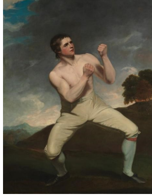
Resim 1. John Hoppner, Boksör Richard Humphreys, 1788 T.Ü.Y. 141,6 x 112,4 cm

John Hoppner'in 1788 tarihli Richard Humphreys portresi (Resim 1), boksun İngiltere'deki sosyal ve kültürel önemini yansıtan çarpıcı bir eserdir. Resimde, boksör Humphreys, güçlü ve kararlı bir duruşla izleyiciye poz verirken, kaslı anatomisi ve gard almış duruşu onun fiziksel gücünü ve cesaretini ön plana çıkarır. Arka plandaki pastoral manzara, sporcuyla vurgulamak için sade bir şekilde düzenlenmiş ve odağın tamamen figür üzerinde olmasını sağlamıştır. Hoppner'in ışık-gölge kullanımı, boksörün vücudundaki kas detaylarını belirginleştirir ve sporcuyla neredeyse bir kahraman figürü gibi yüceltir. Bu portre, boksun yalnızca bir spor değil, aynı zamanda sanatsal ve sosyal bir olay olarak kabul edildiği dönemi estetik bir şekilde temsil eder.