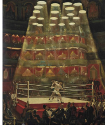
Resim 6. Alfred Reginald Thomson, London Amateur Championships, 1948. Özel Koleksiyon

Thomson'ın 1948 yılında London Amateur Championships adlı eserinde (Resim 6), boksun fiziksel ve gösteri boyutu ele alınmıştır. Resmin merkezinde, ringde birbirleriyle mücadele eden iki boksör yer alırken, etraflarındaki kalabalık izleyici kitlesi sahnenin bir gösteri havasında sunulmasını sağlar. Gösterişli bir mekânın lüks localarına oturan izleyiciler, sahnenin prestijini vurgularken, yukarıdan gelen güçlü spot ışıkları tüm dikkati boksörlere çeker.