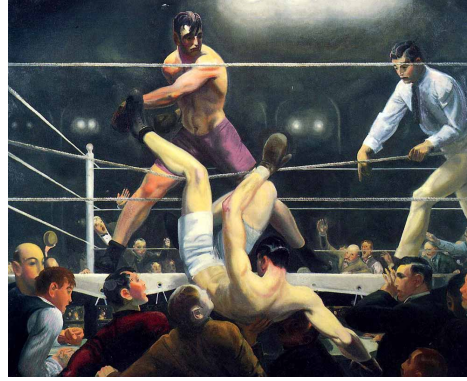
Resim 4. George Wesley Bellows Dempsey ve Firpo Kardeşler Rövanşta, 1924, TÜYB., 129,5 x 160,6 cm. Whitney Museum of American Art, New York.

Amerikan sanatında Ashcan School olarak bilinen realist hareketin önemli bir temsilcisi olan Bellows, 20. yüzyıl başlarında Amerikan şehir hayatının, özellikle işçi sınıfının ve sıradan insanların çetin yaşam koşullarını resmetmeyi amaçlamışlardır (Schreiber, 2011). Bellows, şehir hayatı, sosyal eşitsizlik ve güç temalarını işlerken, eserlerinde sıkça insan bedeninin ve hareketin etkileyici anlarını yakalamayı başarmıştır. Özellikle boks temalı resimleri, Bellows'un fiziksel güç ile psikolojik gerilim arasındaki dinamikleri keşfetme konusundaki ustalığını ortaya koyar (Wolner, 2015).