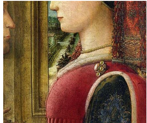
Resim 8: Pencerede Kadın ve Erkek, F. Lippi

Rönesans resimlerinde temsil edilen kimi mücevherlerin ise 'gelin mücevherleri' olduğu yapılan araştırmalar sonucu ortaya koyulan belgelerden anlaşılmaktadır. ' Ayrıcalıklı yurttaşlar sınıfının üyeleri olan