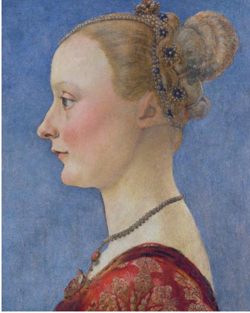
Resim 3: Bir Kadının Portresi A. Pollaiuolo