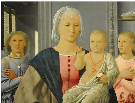
Resim 7: Madonna ve Çocuk, P. D. Francesca