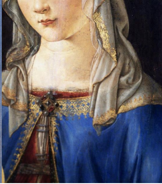
Resim 4: Madonna, A. Verrocchio