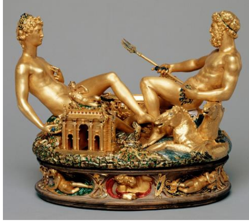
Resim 1: Benvenuto Cellini , Neptün ve Amhidrit, Altın kaplama tuzluk (1549)