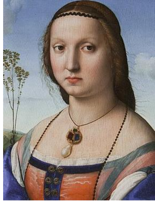
Resim 10: Maddalena Strozzi Doni, Rafeello

Zamanla omuza ve başa takılan takılarda bir azalma, boyuna takılan takılarda bir artış görülmüştür. Bu pandantifler, İtalyan Yüksek Rönesans'ının en önemli ressamı Rafeello'nun ' Maddalena Strozzi Doni Portresi 'nde görülebilmektedir (Resim 10). Bu mücevherler, Maniyerist portreciliğin yetkin örneklerini veren Floransalı ressam Agnolo Bronzino'nun zarif ' Toledolu Elonora ve Oğlu ' portresi gibi (Resim 11) 16. yy resimlerinin çoğunda görülen damla biçimli iri incilerden oluşan görkemli mücevher takımlarının atası sayılmaktadır (Randolph, 2000:50).