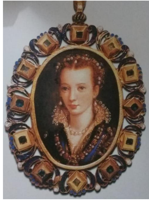
Resim 12: Minyatür Resim, A. Allori

Bronzino'nun öğrencisi olan Alessandro Allori, bir mücevher olarak boyna takılan minyatür portreleriyle ünlüdür (Resim 12). Portreye bakıldığında kadının düğün ya da nişanı sebebiyle takılmış oldukları anlaşılabilir değerli taşlar, inciler ve altınla süslenmiş olduğunu görülmektedir (Randolph, 2000:50). Evlenecekleri kadına bu kadar değerli mücevherler alamayan erkeler kiralama yoluna gittikleri, mücevherlerin düğünden sonra gelinden geri alındığı ticari kayıtlarda görülmektedir. Mücevher ve takı kullanımının yasalarla belirlendiği İtalya Rönesans'ında 1472 tarihli bir yasa, evlenen kadınların hangi mücevherleri ne zaman takacaklarını belirlemektedir (Randolph, 2000:51). Mücevher ve takılar gerek gerçek yaşamda gerek tablolarında insanların bedenini belirli bir biçimde konumlandırmıştır. Yayılmacılığa ve sömürge ticaretine göndermede bulunan egzotik nitelikli mücevherler onları takanların ekonomik gücünü ortaya koymuştur. Evlilik mücevherleri de süsledikleri bedenlere yorumlar getirmişler, onların bağlı oldukları toplumsal kesimleri görsel olarak vurgulamışlardır. Rönesans döneminde mücevher ve takıların, bunları kullananlardan ve bunların kullanımını yasaklayan yada sınırlandıranlardan gördüğü ilgi, toplumsal statünün görselleştirilmesinin yalnızca istenilen bir şey olmadığı aynı zamanda toplumsal bir gereklilik de olduğunu göstermektedir.