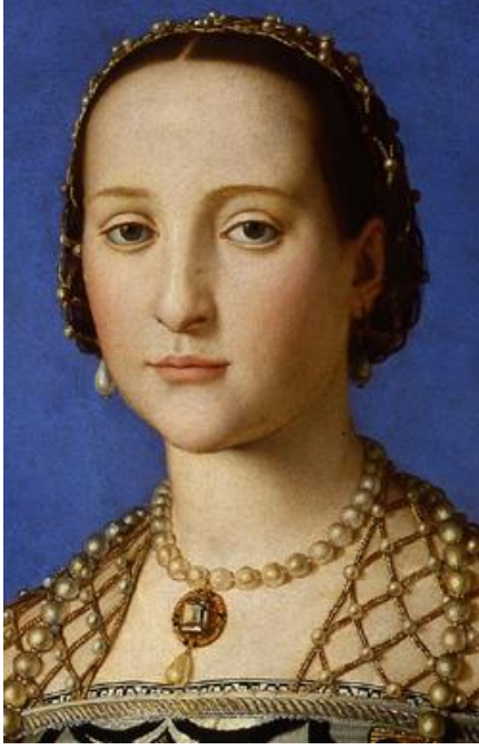
Resim 11: Toledo'lu Elonora, A. Bronzino