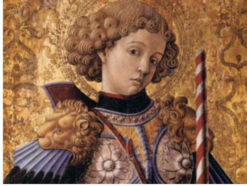
Resim 2: Carlo Crivelli, San Giorgio

olduğunu söyleyen Smith, 'Quattrocento döneminde İtalya'daki kuyumculuk sanatının tarihi büyük ölçüde kendisini, ilk önce kuyumcu olarak çalışan ve kariyerleri boyunca bunun ticaretini yapan usta heykeltıraşların ve ressamların biyografilerine ayırır' demektedir (Smith, 1908:167). 15. ve 16. yy 'da Avrupa'nın en zengin şehri ve başlıca limanı olan Venedik, lüks mücevher kullanımını teşvik etmesine rağmen Floransa, yetiştirdiği sanatçılar sebebiyle bir sanat merkezi olarak başı çekmektedir. Venedik Okulu'ndan resimleri, Carlo Crivelli'nin resimlerinde erkeklerin en az kadınlar kadar süslenmenin güzelliğini yansıttıkları görülür. Neredeyse her ressam, kuyumcu zanaatının sırlarına dair bir bilgiye sahiptir ve her ne olursa olsun konusunu mücevherli aksesuarlarına özen göstererek temsil eder. Siena, Milano ve diğerleri gibi zengin ve sanatsal şehirlerin büyük tüccarları, Venedik ve Floransa'nın yanı sıra, zengin mücevherlerden zevk alan ve merkezleri bu şehirlerde bulunan resim okullarının ustaları, parlak pigmentlerde, günün önde gelen kuyumcularının hünerlerini ve marifetlerini sergiledikleri bu hassas sanat eserlerinin sadık bir kaydını tutmuşlardır (Smith, 1908:167).