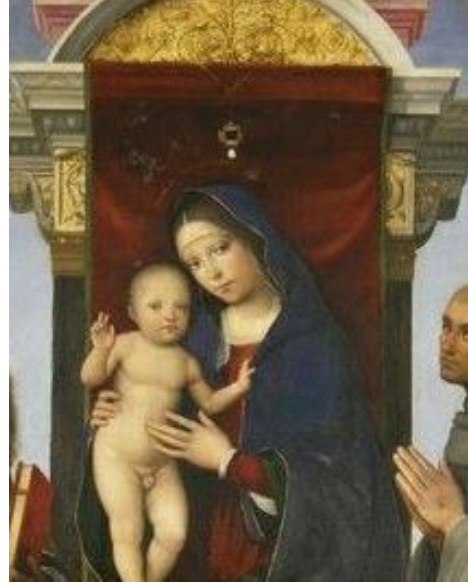
Resim 6: Fellicini Madonna, F. Raibolini