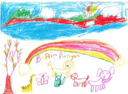
Resim 17: 8 yaş, erkek, çalışma 17

Resim 16'da görüldüğü gibi, 10 yaşındaki erkek öğrenci "benim renkli dünyam" konusunu, resimde dış mekân resmiyle düşsel mekân oluşturmuştur. Resmin zemininde bulunan yeşil kısımda yer çizgisi ile gri zemini kaplayan kayalar yer almaktadır. Resimde, gökkuşağıyla kaplanan mavi alandaki kısımdan yer kısmına uzanan bir turuncu renkle çizilmiş 6 basamaklı bir merdiven dikkati çekmektedir. Üst kısımda renkli harflerle yazılmış benim renkli dünyam yazısı, turuncu ve güler yüze çizilmiş bir balon, sol kısımda uçan bir uçağı andıran kahve renkli nesne, sol üst kısmında bulunan turuncu renkli boyanmış bir güneş görülmektedir. Öğrencinin resminde kullandığı renklerde etkisini hissettiğimiz mavi, turuncu, pembe ve tonları ağırlıktadır. Güneşin sol taraftan görünmesi ve turuncu renkte olması kendi dünyasındaki sevgi tanımını bize renklerle göstermiş olduğuna bir işarettir.