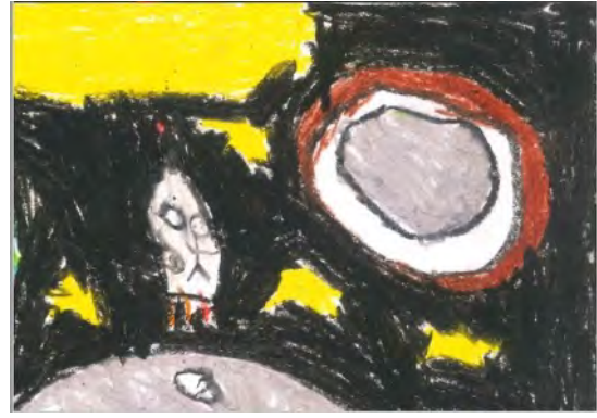
Resim 20: 11 yaş, erkek, çalışma 20