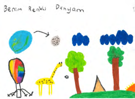
Resim 12: 9 yaş, kız, çalışma 12