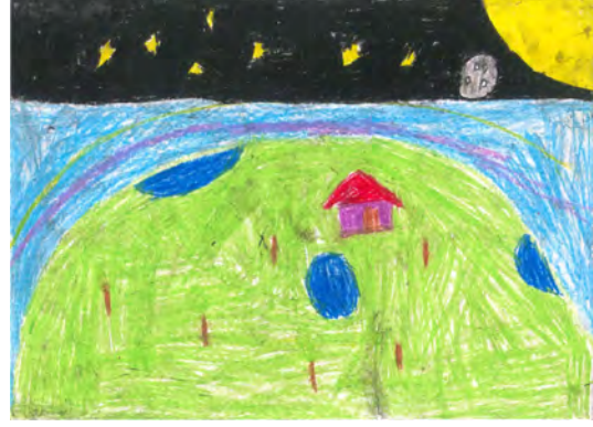
Resim 14: 9 yaş, erkek, çalışma 14