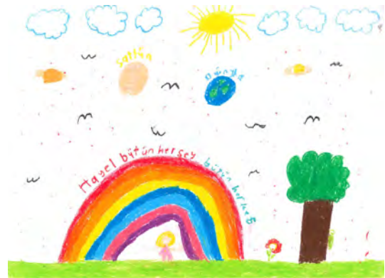
Resim 18: 9 yaş, kız, çalışma 18