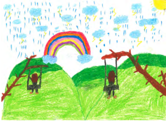
Resim 11: 9 yaş, kız, çalışma 11