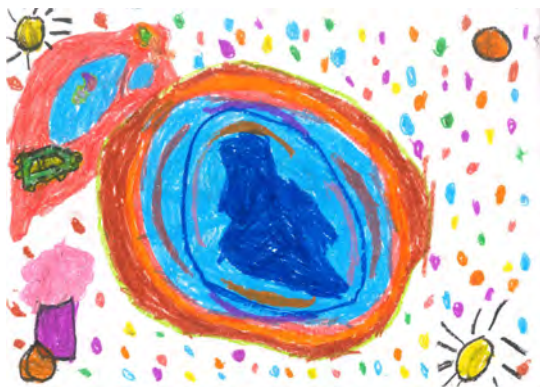
Resim 9: 9 yaş, erkek, çalışma 9

Resimde çizgi bakımından; kalın, keskin ve geometrik çizgiler kullanılmıştır. Gökkuşağının alt kısmına konturlar geçmiştir. Renk çeşitliliği açısından renkleri etkin kullanmıştır. Gökyüzündeki bulutların mavi olması, gökyüzünün açık mavi kullanımı öğrencinin kendi dünyasına kapandığı ve gökkuşağının içindeki kısmında ise iç dünyasını renkli olarak yansıtmıştır. Gökkuşağının renklerine genellikle sıcak renkler hâkimdir.