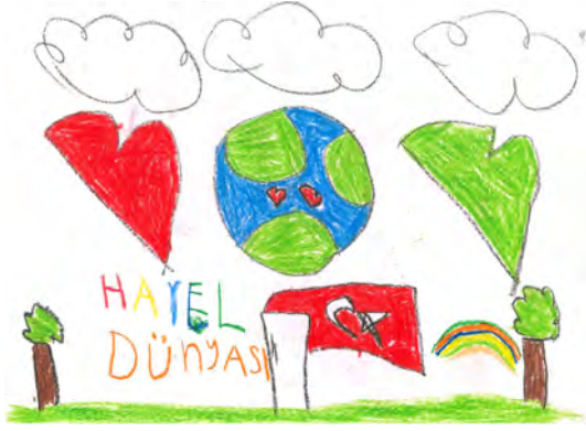
Resim 7: 8 yaş, kız, çalışma 7