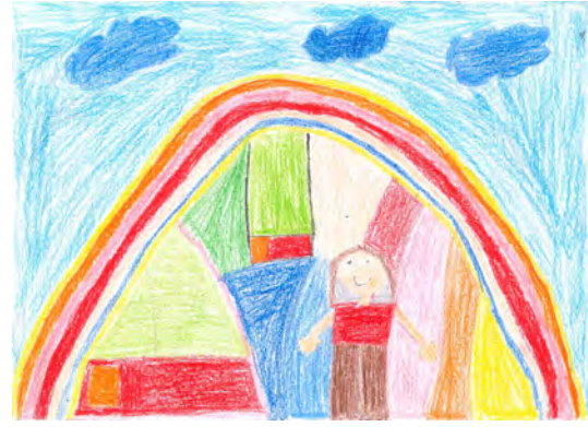
Resim 8: 8 yaş, erkek, çalışma 8