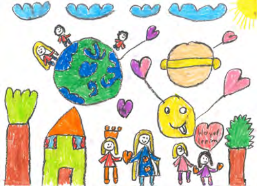
Resim 13: 10 yaş, kız, çalışma 13

renk kullanımı görmekteyiz. Renk olgusunun belirli yaşlarda daha fazla geliştiği ve görsel algının bu gelişimde önem taşıdığı bilinmektedir. Öğrencinin resminde kullanılan renkler; açık mavi, açık yeşil, sarı, turuncu, balonda kullanılan kırmızı, mor, yeşil, sarı ve turuncu renklerdir. Arka plana hiç renk kullanmayan öğrenci arka planı kâğıdın kendi renginde bırakmayı tercih etmiştir.