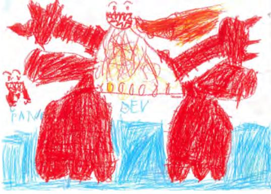
Resim 1: 8 yaş, erkek, çalışma 1