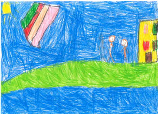
Resim 3: 8 yaş, erkek, çalışma 3

Resim düşsel mekân olarak yaratılmıştır. Öğrenci resminde, düşsel mekânı büyük-küçük ve ön-arka plan ilişkisi ile yaratmıştır. Resmine, sıcak ve soğuk renkler, tek ton değeri egemen olmuştur. Çizgi bakımından; gezegenlerin ve yıldızlara uygulanan siyah renkle konturlar geçmiştir. Resimde renk kullanımı açısından kırmızı ve mavi tonlarının etkin olarak kullanıldığı görülmektedir.