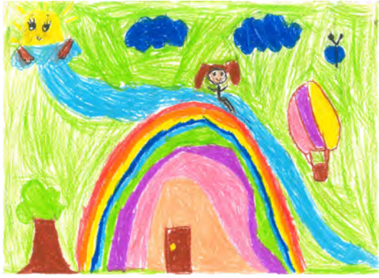
Resim 5: 8 yaş, kız, çalışma 5

Resim 4' te görüldüğü gibi, 7 yaşındaki erkek öğrenci "benim renkli dünyam" konusunu, içerisinde çizimlerin yer aldığı dikdörtgen içinde mavi ve açık mavi tercih ettiği yerleri cetvelle çizip boyayarak oluşturmuştur. Resimde üst planda ana renk olan açık mavi ve mavi renk tek ton olarak kullanılmıştır. Mavi renkli dikdörtgen içine kurşun kalemle çizgisel figür ve nesnelere yapılmıştır. Resimde dikdörtgenin içine çizilen çizgisel figür saydam bir şekilde içinde yer almaktadır. Resim tek tonda yapılmış olup açık koyu kontrast sağlanmıştır. Resim oldukça sade yapılmış ve sadece renk odaklı bitirilmiştir.