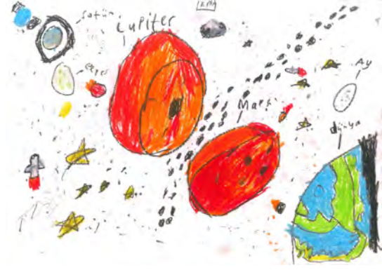
Resim 2: 10 yaş, erkek, çalışma 2