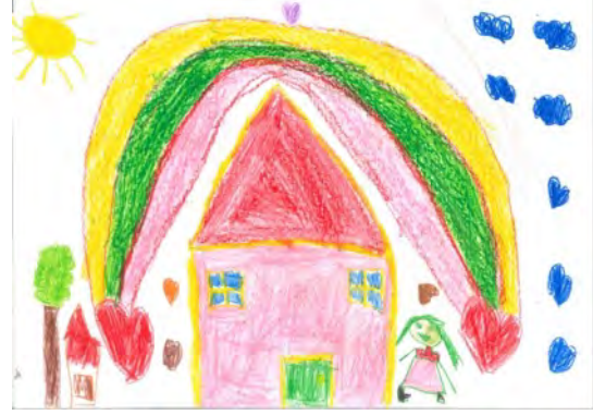
Resim 22: 8 yaş, kız, çalışma 22