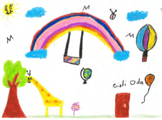
Resim 15: 10 yaş, kız, çalışma 15