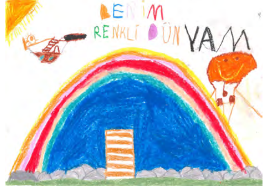
Resim 16: 10 yaş, erkek, çalışma 16