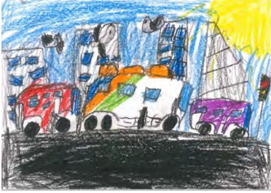
Resim 21: 9 yaş, erkek, çalışma 21

çıkılmaktadır. Gezegenler ya da uzay olarak görünen arka planda kullanılan siyah renk, içinde öğrencinin kendisinin olduğu bir ufo, büyük ve sarı yıldızlar, sağ üst köşede bulunan sarı renkli alansa güneşin olduğu kısımdır. Resmin sol kısmında büyük bir gezegen bulunmaktadır. Resimde genel olarak nötr renklerin kullanımı hakimdir.