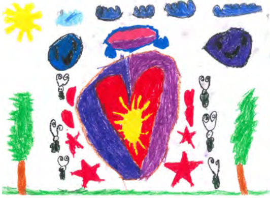
Resim 19: 9 yaş, erkek, çalışma 19

Resim 18' de görüldüğü gibi, 9 yaşındaki kız öğrenci "benim renkli dünyam" konusunu, kendisinin renkli dünyasını, gerçekçi bir manzara resminde dış mekânda resmetmiştir. Üst kısımda mavi renkli çizgisel çizilen bulutlar, orta kısımda parlayan sarı bir güneş, orta kısımda görülen gezegenler, siyah çizgisel olarak çizilen kuş figürleri, alt alanda kırmızı, koyu turuncu, açık turuncu, mavi, koyu mavi, pembe ve mor olarak görülmektedir. Gökkuşağı altında görülen öğrencinin kendisini çizdiği figürde pembe ve sarı renkte kendisini çizmiştir. Sağ kısımda ağaç çizimi ve çiçek yer almaktadır. Hayal dünyasını tanımlarken gökkuşağı ve gezegenleri araç olarak kullanmıştır. "hayel bütün herşey bütün herkes" yazısı kırmızı ve mavi renklerle yazılmış ve gökkuşağının renklerini de desteklemiştir. Hayal dünyasını genellikle gökkuşağıyla bağdaştırması ve renk seçimiyle bize duygu durumu hakkında bilgi vermektedir.