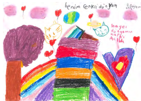
Resim 10: 9 yaş, kız, çalışma 10