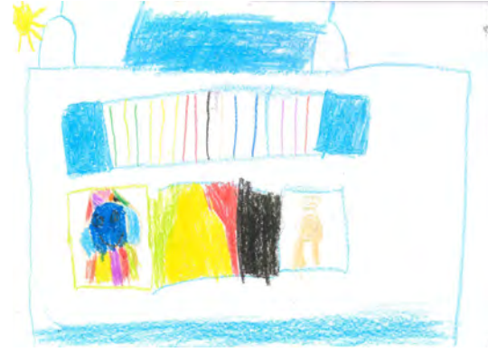
Resim 6: 9 yaş, erkek, çalışma 6