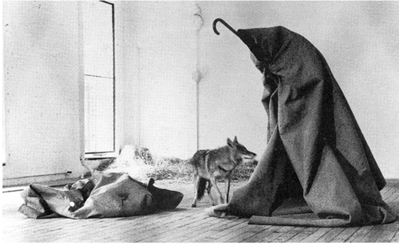
Joseph Beys - I like America and America likes me, 1974 - installation

Benzer şekilde -bu defa canlı olarak- hayvan figürü kullandığı işlerinden biri de 1974'te New York'da, Rene Block Gallery'de gerçekleştirdiği "Coyote: Amerika'yı Seviyorum, Amerika da Beni" isimli performansdır.