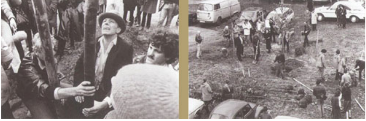
Görsel 4. Joseph Beuys, '7000 Meşe', Almanya, 1982, Yeung, (t.y).

Çalışmanın, Beuys tarafından bugüne kadar başlatılan en kapsamlı proje olması amaçlanmıştır. Dikilen her bir meşe fidanını yanına basalt taşlardan dikilmiştir, bu durum çevresel amacının yanı sıra gezegeni dönüştürmek için yaratıcılık ve hayal gücünün gücü için sembolik işaretler olarak hizmet etmiştir. Sokaklarda ve ara sokaklarda, otoparklarda ve oyun alanlarında duran ve barışı, dostluğu ve para, zaman, enerji ve uzmanlık bağışlayan herkesin çabasını simgeleyen ağaçlar ve taşlar, Beuys'un ideallerinin her zaman mevcut bir hatırlatıcısı olmuştur. Şehri asfalt ve katranla kaplı bir şehirden, tamamen yeşilliklerle kaplı bir alan yaratmayı başarmıştır. 7000 Meşe dünya çapında sanatçılar ve çevre aktivistleri tarafından hala devam ettirilmektedir.