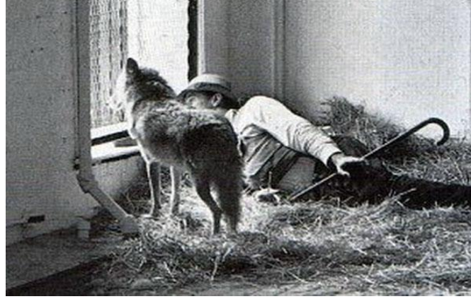
Görsel 3. Joseph Beuys, Coyote: Amerika'yı Seviyorum, Amerika da beni, Performans, 1974, Rene Block Gallery, New York, Yeung, (t.y).

Kır kurdu, yerli halkı temsil etmekte ve beyaz Amerika'nın yerlilere uyguladığı soykırıma işaret etmektedir. Beuys bu aksiyon için teklif aldığı tek şartı Amerika'ya ayak basmamak ve kimseyi görmemek olmuştur. Bu nedenle bir sedye yardımıyla gözleri kapalı şekilde mekâna getirilmiş ve aynı şekilde geri götürülmüş, bu sayede karşılaştığı tek canlı Amerika'nın asıl sahipleri olan yerli halkı temsilen kır kurdu olmuştur. Beuys üç gün boyunca elinde bastonu ve sırtında keçe battaniyesi ve performans eşlik eden bir dizi sembolik nesne ile şaman ritüellerine benzer hareketler yapmış, bir süre sonra kurdun parçalaması üzerine keçeden kurtulmuştur. İki yabancıнын bir süre sonra ısı ve koku transferleri sayesinde tanışıklıkları artmış ve vahşi olan kurt ile Beuys hiçbir zarar görmeden birlikte yaşama deneyimini gerçekleştirmişlerdir.