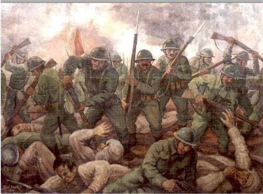
Resim 2. Şeref Akdik, "Kurtuluş Savaşı", 1917, 156 x 208 cm., T.Ü.Y.B.