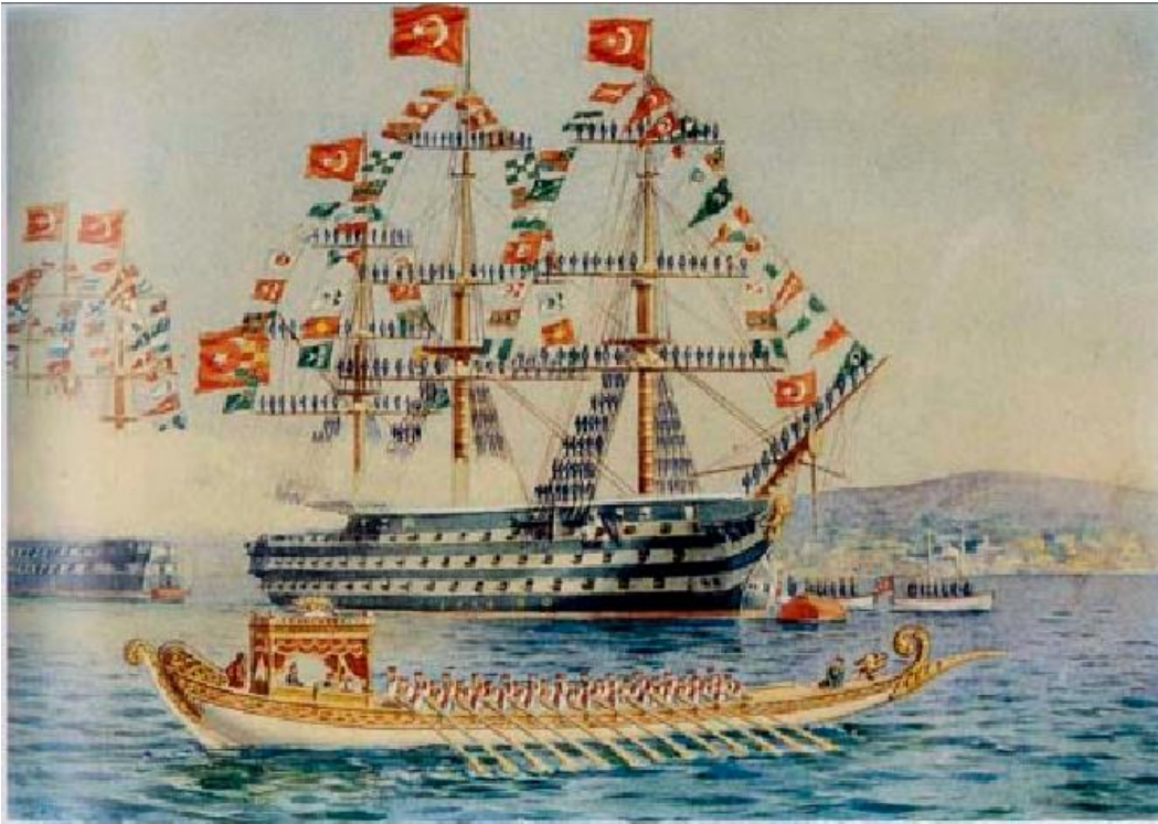
Resim 7. Hüseyin Hüsnü Tengüz, "Sultan Abdülmecit'in Donanma Teftişi", 1946, 26x19 cm., Suluboya.

Bu açıdan bakıldığında da, Tengüz'ün resimlerindeki donanmaya ait gemiler, deniz savaşlarının belgesi niteliğindedir. Bununla birlikte Tengüz'ün resimlerindeki bayraklar bulunduğu döneme göre değişmektedir. "Donanma" adlı çalışmasında Osmanlı'ya ait yeşil bayraklar bulunurken, 1946 yılında yapmış olduğu "Sultan Abdülmecit'in Donanma Teftişi" adlı çalışmada Cumhuriyet sonrası Türk bayrağını görmek mümkündür. Kâğıt üzerine suluboya olarak üretilmiş çalışmada, yüzeyin büyük bir bölümünü kaplayan bir donanma gemisinin üstünde birçok Türk bayrağı bulunmaktadır. Sol tarafta daha uzakta duran ve üzerinde yine bayrakların olduğu bir gemi ve sağ tarafta her iki gemiye göre daha uzakta duran bayraklı gemi bulunmaktadır.