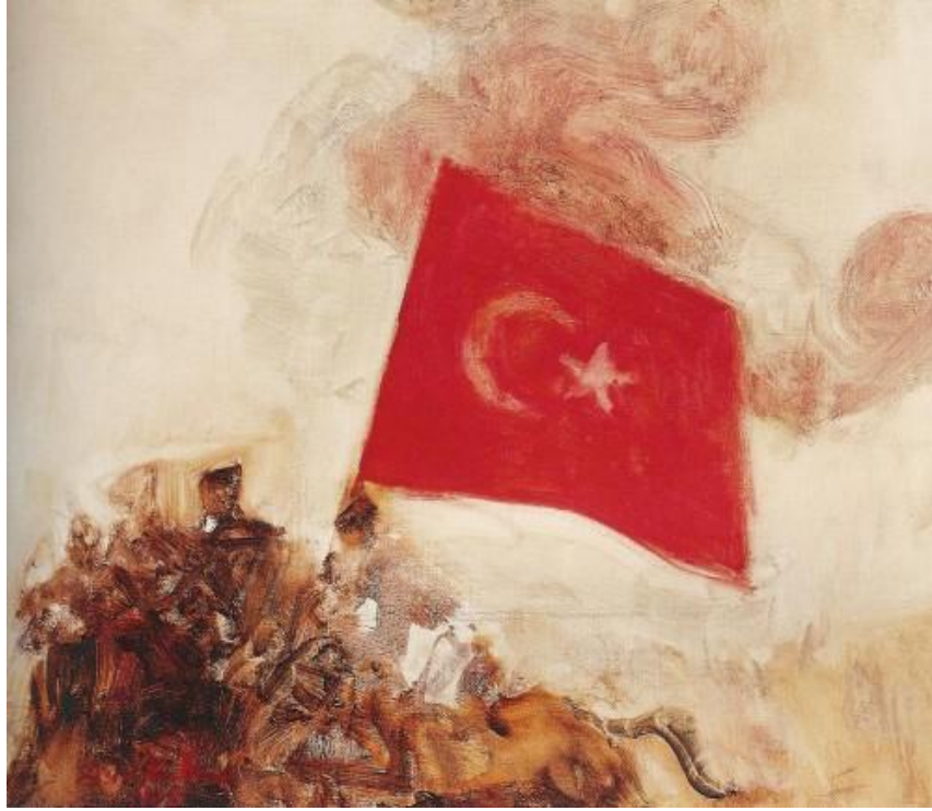
Resim 5. Avni Arbaş, "Kuvâ-yi Milliye Atlıları" 1995, 475 x 545 cm., T.Ü.Y.B

Sanatçının 1995'de yapmış olduğu "Kuvâ-yi Milliye Atlıları" çalışması, 475 x 545 cm. boyutlarında anıtsal bir tuvalden oluşmaktadır. Kompozisyonun tam merkezinde bulunan Türk bayrağı, atlıların elinde taşınmaktadır. Sol alt tarafta duran atlı figürleri diğer çalışmalarda olduğu gibi soyutlanmıştır. Fakat bayrak, gerçeğe yakın ifade edilmiştir. Bayrak, kompozisyondaki oluşturulan boşluğun etkisi ve taşıdığı renk, leke değeri ile çalışmada en önemli öğeye dönüşmektedir. Kurtuluş Savaşı'na saygı amaçlı yapılmış olmakla birlikte Türk bayrağının, Türklük ve ulusal birlik ideolojisinden hareketle sembolleştirildiği söylenebilir.