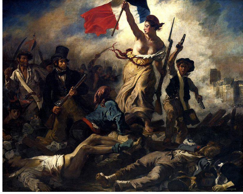
Resim 1. Eugene Delacroix, "Halka Yol Gösteren Özgürlük", 1830, 260x325 cm, T.Ü.Y.B.