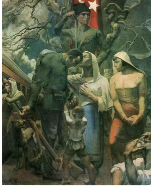
Resim 3. Abidin Elderoğlu, " Ayrılış ", 1935, 153 x 182 cm., T.Ü.Y.B.

Abidin Elderoğlu'nun 1935 yılında İzmir Halkevi tarafından sipariş edilen çalışması " Ayrılış ", savaş resimleri açısından farklı bir örnektir. Sanatçının bu eseri daha önceki bölümlerde değinildiği gibi İnkılap Sergileri kapsamında sergilenmiştir. Çalışmada bir savaş anından çok savaşın geri planı aktarılmaktadır. Resimde tren istasyonunda bir askerin savaşa gönderilme sahnesi aktarılmaktadır. Ortada anne, sol tarafta elinde tüfeği ile asker, sağ tarafta da genç bir kadın figürü birlikte durmaktadır. Arka üst planda bayrak taşıyan asker figürü ile orta bölümdeki figürler üçgen kompozisyonun oluşmasını sağlamaktadır. Askerin elini tutan çocuk figürü eserin dramatik özelliğini arttırmaktadır. Annenin gurur dolu jesti ise, "vatan görevi kutsaldır" söylemini vurgulamaktadır. Çalışmada bayrak, onu taşıyan askerin gururu ile birlikte, vatani ve kutsal görev olan savaşı simgeleyen nesneye dönüşmektedir.