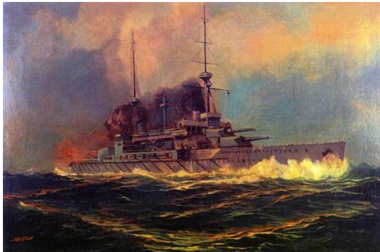
Resim 6. Diyarbakırlı Tahsin, "Sultan Osman Drednotu", 1916, 181 x 121 cm., T.Ü.Y.B.

19. yüzyıl resimlerinde çoğunlukla Osmanlı'nın kuşatmaları temsil edilmektedir. Bu resimlerde, genellikle açık denizlerde dolaşan gemiler; ya taarruz anında ya da yaralandığı anlar, ya da zaferden dönerken temsil edilmektedir. Çalışmalar, isimlerini, genellikle savaş gemilerinden aldıkları gibi, savaşın bulunduğu ada, devlet isimlerinden de almaktadır. Günümüze oranla sınırlı teknolojik imkanların bulunduğu dönem olan 19. yüzyılda savaş gemileri devletin gücünü temsil eden bir araç gibi görülebilir. Böyle bir imgenin resim sanatına yansımaları, devletin gücünü pekiştiren bir araç olduğu düşünülebilir. Kara savaşlarındaki gibi, yaralı veya cepheden mektup yollayan askerler, top taşıyan Anadolu kadınları ya da kağnı arabaları gibi, izleyicide şefkat, hüznün, gurur gibi duygular birinci elden insan figürü üzerinden aktarılmamaktadır. Mekanik araç gemiler insan gücüyle çalışmaz fakat insan kontrolünde çalışmaktadır. Makinenin ilerlemesini sağlayan insan, artık birey değil, mekanik sistemle birlikte orduyu, ordu da devleti oluşturmaktadır. Böylece gelecek nesillere savaşın atmosferi ve ordunun gücü aktarılmaktadır.