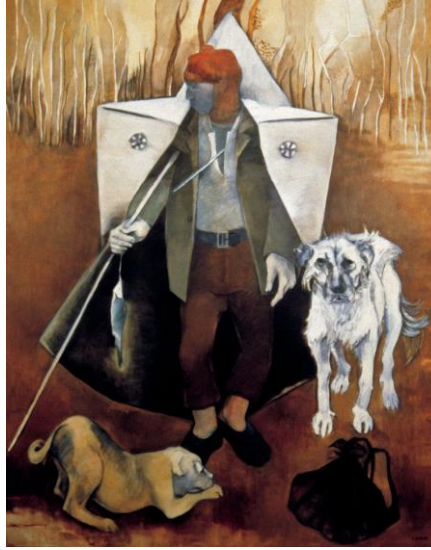
Görsel 9: Neře Erdok, Çoban, T.Ü.Y.B., 200 x 160 cm, Özel Koleksiyon, 1982 (Tansuđ, 1991: 292).

Türk resim sanatı alanında figüratif ve soyut kompozisyon arařtırmaları, 1970' den bu yana bir yanıyla ortak diđer yanıyla da karřıt yol ve yöntemler izlemiş ve bu üslup eğilimlerinin, bireysel özgünlük yollarını arařtıran çok yönlü çabaları yansıtmaları, Türk resminin ferah ve geniş bir soluđa kavuřtuđunun iřareti olmuřtur (Tansuđ, 1991: 286). Neře Erdok, 1970'li yıllarda yođun bir belirginlik kazanan figüratif akımların, yeniden güçlenme süreci içinde üslup yanılıđlarına dönüřebilecek herhangi bir fantastik eğilime kapılmadan, eserlerinde anıtsal bir ifade olgusunu gözler önüne sermiřtir (Tansuđ, 1991: 292). Neřet Günal'ın öđrencisi olan ve onun figür ađırlıklı eğilimini devam ettiren sanatçı, dıřavurumcu, gerçekeçi anlatım tarzında yapmıř olduđu toplumsal içerikli resimlerinde yalnızlık, hastalık, korku, tedirginlik gibi konuları ele almıřtır (Ersoy, 2004:205).