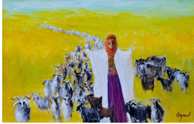
Görsel 8: Fikret Otyam, Otyam'ın Fırçasından, T.Ü.Y.B., 30 x 45 cm ("Sanal", 2021).