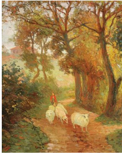
Görsel 4: Nazmi Ziya Güran, Kırmızı Giysili Çoban ve Koyunlar, T.Ü.Y.B., 81 x 65 cm, 1919 ("Sanal", 2021).

1908'de kurulan Osmanlı Ressamlar Cemiyeti'nin asker kökenli ressamlarından sivil kuşağa geçişi, Çallı grubu ya da 1914 Kuşağı olarak bilinen İzlenimci ressamlar kuşağıyla gerçekleşmiştir. Eski adı Sanayi-i Nefise olan Güzel Sanatlar Akademisi'nden mezun olduktan sonra 1910 yılında Avrupa'ya sanat eğitime gönderilen bu grup, 1914 yılında I. Dünya Savaşı'nın başlamasıyla yurda dönerek akademinin öğretim kadrosunda görev alarak, gelecek kuşakların yetişmesinde önemli rol oynamışlardır. Türk resminde figür geleneğini başlatan Osman Hamdi'den bu ressamalara geçiş, aynı zamanda modernleşme sürecinin de başlangıcını oluşturmaktadır. İbrahim Çallı'nın liderlik yaptığı bu kuşak Hikmet Onat, Feyhaman Duran, Avni Lifij, Namık İsmail, Nazmi Ziya Güran gibi isimlerden oluşmaktadır (Renda vd., 1993: 51).