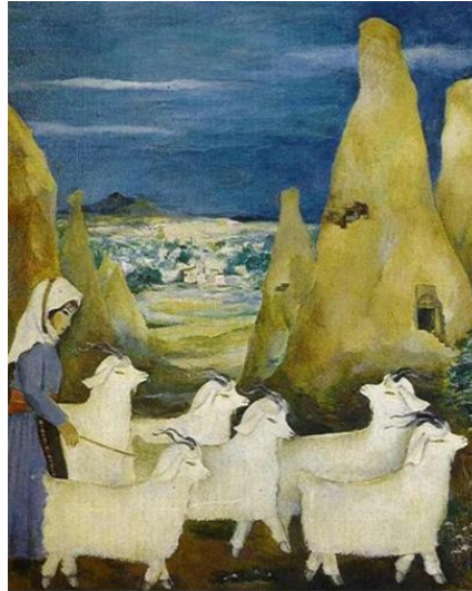
Görsel 7: Turgut Zaim, Ürgüplü Yörükler, T.Ü.Y.B., 85 x 65 cm (Özel, 1992: 96).

Klasik anlayıştaki figüratif resimleriyle tanınan Halil Dikmen, Paris'te Laurens Atölyesi'nde çalıştığı süre zarfında Rönesans sanatçıların tekniklerini inceleyerek, ışık-gölge kullanımları üzerine araştırmalar yapan ve eserlerine yansıtan önemli sanatçılardandır. D Grubu'nda yer almasına rağmen sanatsal kişiliği grubun savunduğu ilkelerle uyum sağlamış, ölüdoğa, manzara ve figür çalışmalarında gerçekçi geleneğe bağlı kalmıştır (Dal, 2008: 406). Halil Dikmen tarafından yapılan Yörükler (Görsel 6) isimli resimde, Yörük kadınlarının doğa içerisindeki yaşamlarından bir kesit yansıtılmaktadır. Eserin ön planında koyunların başında bekleyen genç bir çoban ve köpeği, sağ tarafta yün eğiren kadın, yayık ayran yapan genç bir kız ve kucagındaki çocuğuyla onu izleyen başka bir kadın, geri planda ise Yörük çadırlarının önünde oturan, çalışan diğer kadın figürleri görülmektedir. Kompozisyonda yer alan figürler her ne kadar durağan bir yapı içerisinde olsa da resmin sağ üst köşesinden sol alt köşesine doğru diyagonal bir kurgu içerisinde yerleştirilmesi resme hareketlilik katmaktadır. Ayrıca bu hareketlilik beyaz rengin yerleştirilme düzeniyle de desteklenmektedir. Yeşil rengin hakim olduğu eserde, erkek figürün üzerinde kullanılan kırmızı renk kontrastlık oluşturmakta ve genç çobanı ön plana çıkarmaktadır. Resimde, kırsal kesimde yetişen erkek çocuğun, koyun, keçi gibi büyük hayvanları güderek, onlara göz kulak olduğu görülmektedir.