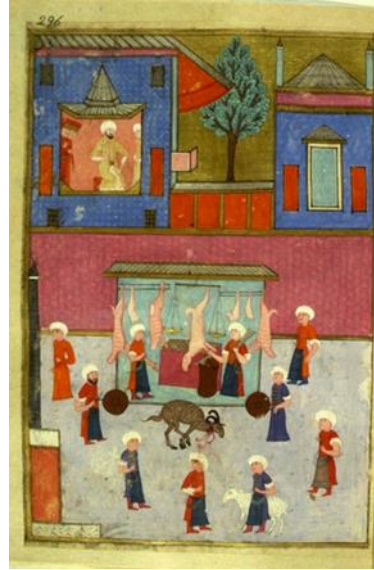
Görsel 2: Surname-i Hümayun'da şenlikler esnasında kasapların, çobanların, salhanecilerin ve debbağların geçişinden bir sahne ("Sanal", 2021).

XVIII. yüzyılın başlarından itibaren resim alanında, batılılaşmanın etkisiyle geleneksel tekniğe ek olarak gölgeli renklendirme sayesinde derinlik kazandırılmış ve böylece hacimli unsurlar ortaya çıkmaya başlamıştır. Aynı yüzyılın sonlarına doğru tutkallı toprak boyanın kullanılmaya başlamasıyla da bazı yazmalar geleneksel minyatür sanatını sonlandıran tekniklerle resimlendirilmiştir. Bu dönemde tasvir, kitap sayfalarından duvar ve tuval yüzeylerine taşmıştır. XIX. yüzyılın başından itibaren Osmanlı minyatürü artık önemini yitirmeye başlamış ve bu dönem sanatçıları Tanzimat sonrası açılan okullarda başlatılan Batı resmi eğitimiyle yaygınlaşacak olan yeni resim geleneğinin öncüleri olmuşlardır (Mahir, 2005: 174). III. Selim Dönemi'nde kurulan Mühendishane-i Berri-i Hümayun'un programına konan resim dersleri sayesinde, Avrupa yöntemlerine göre yetiştirilmek istenen genç subaylara askerlikle ilgili teknik çizimleri ve askerlik krokilerini çizebilme yeteneği kazandırılmış (Renda ve Erol, 1980: 86) ve böylece asker kökenli ilk ressamlar yetişmeye başlamıştır. Mühendishane ve Harbiye çıkışı olan ve büyük bir bölümü askeri rüştiyelerde ya da Mühendishane' de resim öğretmenliği yapan bu ressamların çoğu yurtdışına öğrenci olarak gönderilmiş ve dönüşlerinde Batı'nın çağdaş sanat anlayışını eserlerine yansıtmışlardır (Renda vd., 1993: 25).