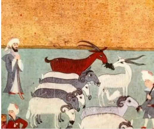
Görsel 1: Surname-i Hümayun'da şenlikler esnasında çobanların geçişinden bir sahne ("Sanal", 2021).

Osmanlı minyatür sanatına yeni tasarımlar kazandıran XVII ve XVIII. yüzyılların resimli surnameleri, dönemin esnaf loncalarının etkinliklerini, düzenlenen eğlenceleri, şenlikleri ve sosyal hayatı belgelemeleriyle kültür tarihi açısından önem taşımaktadır (Mahir, 2005: 100). Surname-i Hümayun yazma eserinde yer alan minyatürlerde, şenlikler esnasında düzenlenen geçit törenlerinde çobanların da hayvanlarıyla birlikte geçişi görülmektedir (Görsel 1, Görsel 2).