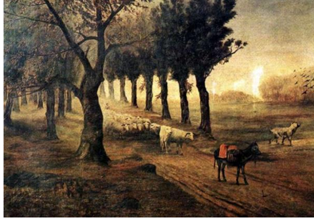
Görsel 3: Şeker Ahmet Paşa, Ormanda Koyun Sürüsü ("Sanal", 2021).

Askeri ressamlar kuşağının önemli temsilcilerinden biri olan Şeker Ahmet Paşa, yapmış olduğu natüremort ve manzara çalışmalarıyla Türk resim sanatının temel taşlarından biri olmuştur. Sanatçının, eserlerindeki ayrıntıcı yaklaşımı, renk ve ışık-gölge tekniğini ustaca kullanımı, sabırlı ve titiz çalışma tarzını gözler önüne sermektedir.