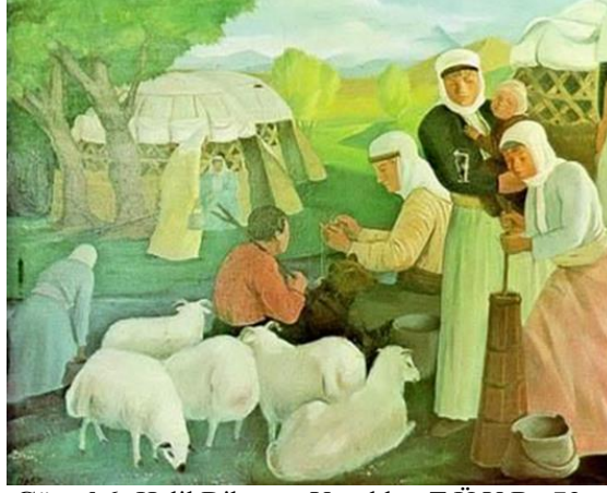
Görsel 6: Halil Dikmen, Yörükler, T.Ü.Y.B., 73 x 92 cm, İzmir Resim ve Heykel Müzesi (Özsezgin, 1982: 26).

Klasik anlayıştaki figüratif resimleriyle tanınan Halil Dikmen, Paris'te Laurens Atölyesi'nde çalıştığı süre zarfında Rönesans sanatçıların tekniklerini inceleyerek, ışık-gölge kullanımları üzerine araştırmalar yapan ve eserlerine yansıtan önemli sanatçılardandır. D Grubu'nda yer almasına rağmen sanatsal kişiliği grubun savunduğu ilkelerle uyum sağlamış, ölüdoğa, manzara ve figür çalışmalarında gerçekçi geleneğe bağlı kalmıştır (Dal, 2008: 406). Halil Dikmen tarafından yapılan Yörükler (Görsel 6) isimli resimde, Yörük kadınlarının doğa içerisindeki yaşamlarından bir kesit yansıtılmaktadır. Eserin ön planında koyunların başında bekleyen genç bir çoban ve köpeği, sağ tarafta yün eğiren kadın, yayık ayran yapan genç bir kız ve kucagındaki çocuğuyla onu izleyen başka bir kadın, geri planda ise Yörük çadırlarının önünde oturan, çalışan diğer kadın figürleri görülmektedir. Kompozisyonda yer alan figürler her ne kadar durağan bir yapı içerisinde olsa da resmin sağ üst köşesinden sol alt köşesine doğru diyagonal bir kurgu içerisinde yerleştirilmesi resme hareketlilik katmaktadır. Ayrıca bu hareketlilik beyaz rengin yerleştirilme düzeniyle de desteklenmektedir. Yeşil rengin hakim olduğu eserde, erkek figürün üzerinde kullanılan kırmızı renk kontrastlık oluşturmakta ve genç çobanı ön plana çıkarmaktadır. Resimde, kırsal kesimde yetişen erkek çocuğun, koyun, keçi gibi büyük hayvanları güderek, onlara göz kulak olduğu görülmektedir.