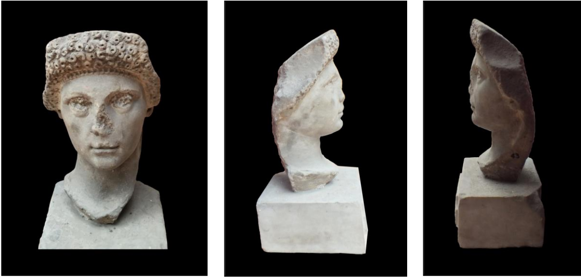
Resim 1, 2, 3. Özel kadın portresi, Nerva-Erken Traianus dönemi (Fotoğraf, Arlı, Y. 2018).