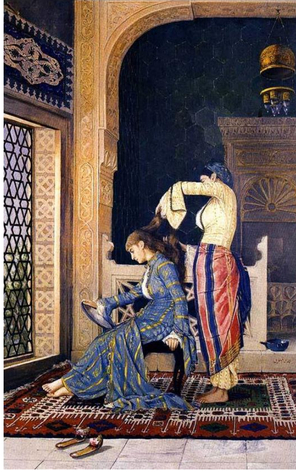
Resim 3. Saçlarını-taratan-kız, Tarih:1882, Ölçüler: 58 x 39 cm.

yanında kadınların kendi bakımlarını ihmal etmediğini de göstermek ister gibidir. Görüntüsel göstergelerin kullanılmış olduğu bir resimdir.