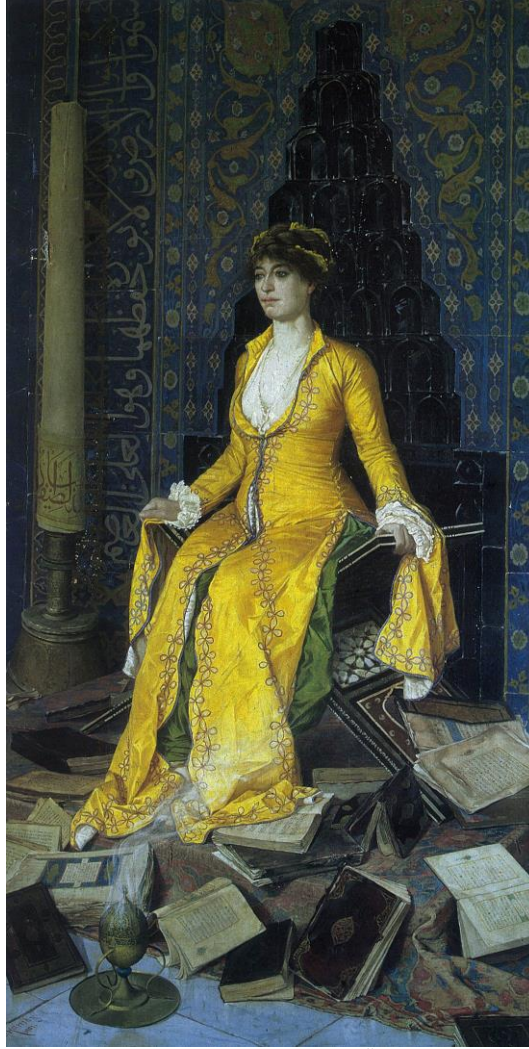
Resim 4. Mihrap (Yaratılış), Tarih:1901, Ölçüler: 210 x 108 cm.

İzleksel düzey: Ressamın yaptığı resimler yaşadığı tarihi nitelendirmektedir. Ressam bu yapıtında Osmanlı mimari unsurlarından çiniye yer vererek ve kendi eklediği objeler ile kurgulayarak çalışmıştır. Mihrap tablosu izleyicilerde değişik duygular uyandırmaktadır. Kadının bilgili olduğu yanında ana olduğu yönünde resimde yansıtılmaktadır. Her şeyin merkezinde kadının yer aldığı anlatılmak istenmektedir diyebiliriz. Kitapların yerde ve dağınık olması hepsinin kadın tarafından okunmuş olabileceği izlenimi vermektedir. Kadının sandalye yerine rahlede oturuyor olması onun bilgeliğinin diğer bir göstergesidir denilebilir. Görüntüsel göstergelerin kullanılmış olduğu bir resimdir.