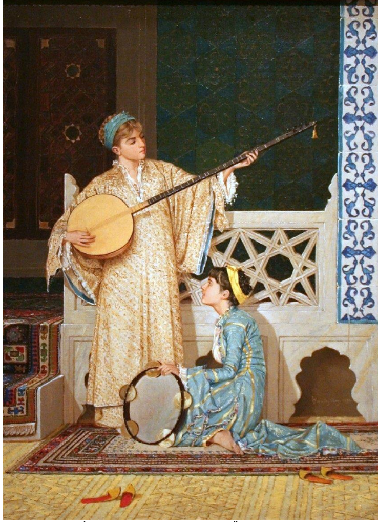
Resim 1. İki müzisyen kız, Tarih:1880, Ölçüler: 58 cm. x 39 cm