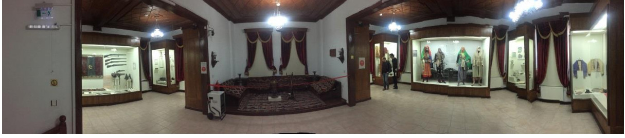
Resim 9: Söğüt Ertuğrul Gazi Müzesi 1. Kat sergi alanı (Bağlantı 9, 2020)

Söğüt Ertuğrul Gazi Müzesi'nde: çiniler, yöresel giysiler, takılar, işlemeli örtüler, Sancak, mutfak kullanım malzemeleri (güğüm, yayık, kap kacak gibi), el dokuma kilim ve halı örnekleri, tarihi paralar, silahlar, ölçü ve tartı aletleri, döneme ait konut içi tasvirleri yer almaktadır (Resim 10, 11, 12, 13, 14, 15). Müze geleneksel yaşama ait etnografik örneklerle geçmişi bugüne getirmekte, yaşatmaktadır.