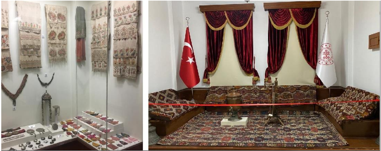
Resim 13, 14: Söğüt Ertuğrul Gazi Müzesi sergilenen eserler (Bağlantı 13, 14, 2020)