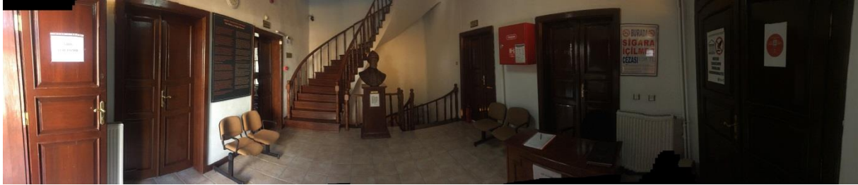
Resim 8: Söğüt Ertuğrul Gazi Müzesi giriş katı (Bağlantı 8, 2020)

Müze işlevi ile hizmete açılan yapıda aslına uygun olarak giriş kat ve birinci kat planı aynıdır. Ancak müze olarak yeniden işlevlendirilen yapıda üst katta orta alandan odalara geçiş mekanlarındaki kapılar kaldırılarak sergileme mekanı için uygun hale getirilmiştir.