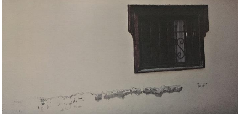
Resim 6: Dış duvar sıvalarında dökülmeler (Bağlantı 6, 2020)

Onarım ve yeniden işlevlendirme kapsamında çevre düzenlemesi, teşhir ve tanzim ve sergileme açısından gerekli düzenlemeler yapılmıştır (Resim 7, 8, 9).