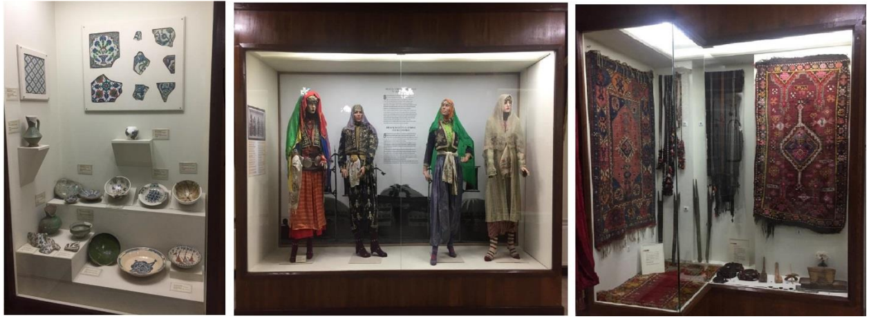
Resim 10, 11, 12: Söğüt Ertuğrul Gazi Müzesi sergilenen eserler (Bağlantı 10, 11, 12, 2020)

Söğüt Ertuğrul Gazi Müzesi'nde: çiniler, yöresel giysiler, takılar, işlemeli örtüler, Sancak, mutfak kullanım malzemeleri (güğüm, yayık, kap kacak gibi), el dokuma kilim ve halı örnekleri, tarihi paralar, silahlar, ölçü ve tartı aletleri, döneme ait konut içi tasvirleri yer almaktadır (Resim 10, 11, 12, 13, 14, 15). Müze geleneksel yaşama ait etnografik örneklerle geçmişi bugüne getirmekte, yaşatmaktadır.