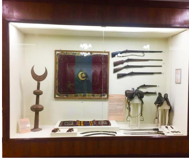
Resim 15: Söğüt Ertuğrul Gazi Müzesi sergilenen eserler (Bağlantı 15, 2020)