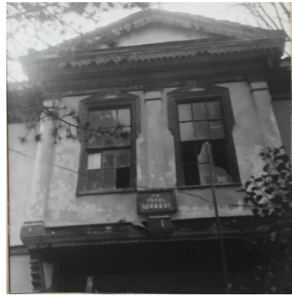
Resim 1, 2: Depo binası ön cephe (Kuzey) ve ön cephe detayı (Bağlantı 1, 2, 3, 4)