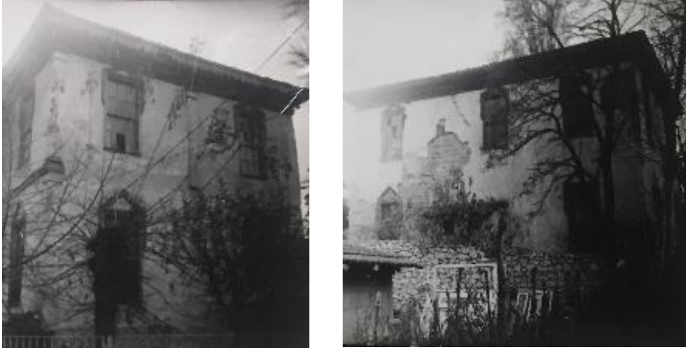
Resim 3, 4: Depo binası batı cephesi ve güney cephesi (Bağlantı 3, 4, 2020)