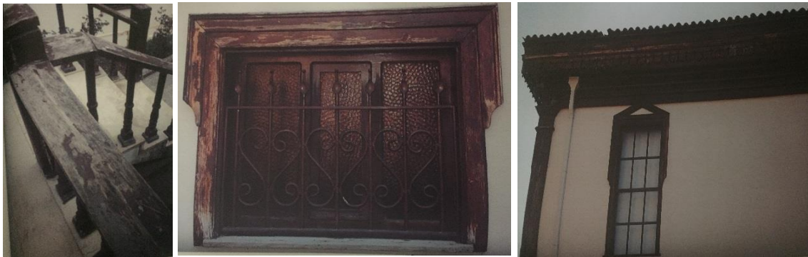
Resim 5: Yeni işlev öncesi ahşap mimari unsurlar (Bağlantı 5, 2020)

Yapılan çalışmalarda yapının belirli kısımlarında sehim ve çökmeler olduğu, zemin ve üst kat ahşap döşemelerinde bozulmalar ve açılmalar tespit edilmiştir. Yeniden işlevlendirme çalışmalarında gerekli görülen güçlendirme ve onarım çalışmaları yapılmıştır (T.C. Kültür ve Turizm Bakanlığı Eskişehir Kültür Varlıklarını Koruma Bölge Kurulu, 11.05/5).