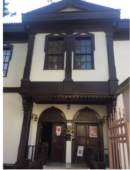
Resim 7: Söğüt Ertuğrul Gazi Müzesi ön cephe (Kuzey) (Bağlantı 7, 2020)