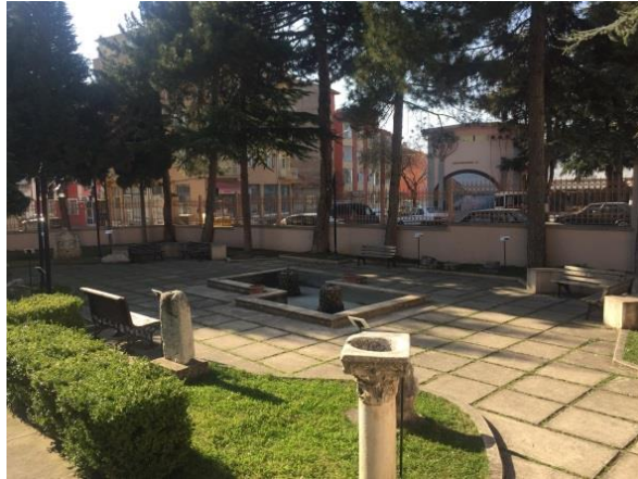
Resim 17: Müze bahçesinde taş eserlerin sergilemesi (Bağlantı 17, 2020)

1994 ile 1995 yıllarında alınan karara göre Tekel Depo Binasına bitişik İç İşleri Bakanlığı kullanımında olan ve halen üzerine Kaymakamlık Lojmanı bulunan köşe başındaki parselin Müze Müdürlüğü bünyesine katılmasının müzenin açık hava teşhir alanı ve bahçesi olarak tanziminin uygun olacağı görüşü kabul edilerek müze bünyesine katılmıştır. Dolayısıyla günümüzde müze bahçesinde sergilenen taş eserlere de yer verilmiştir (Resim 17).