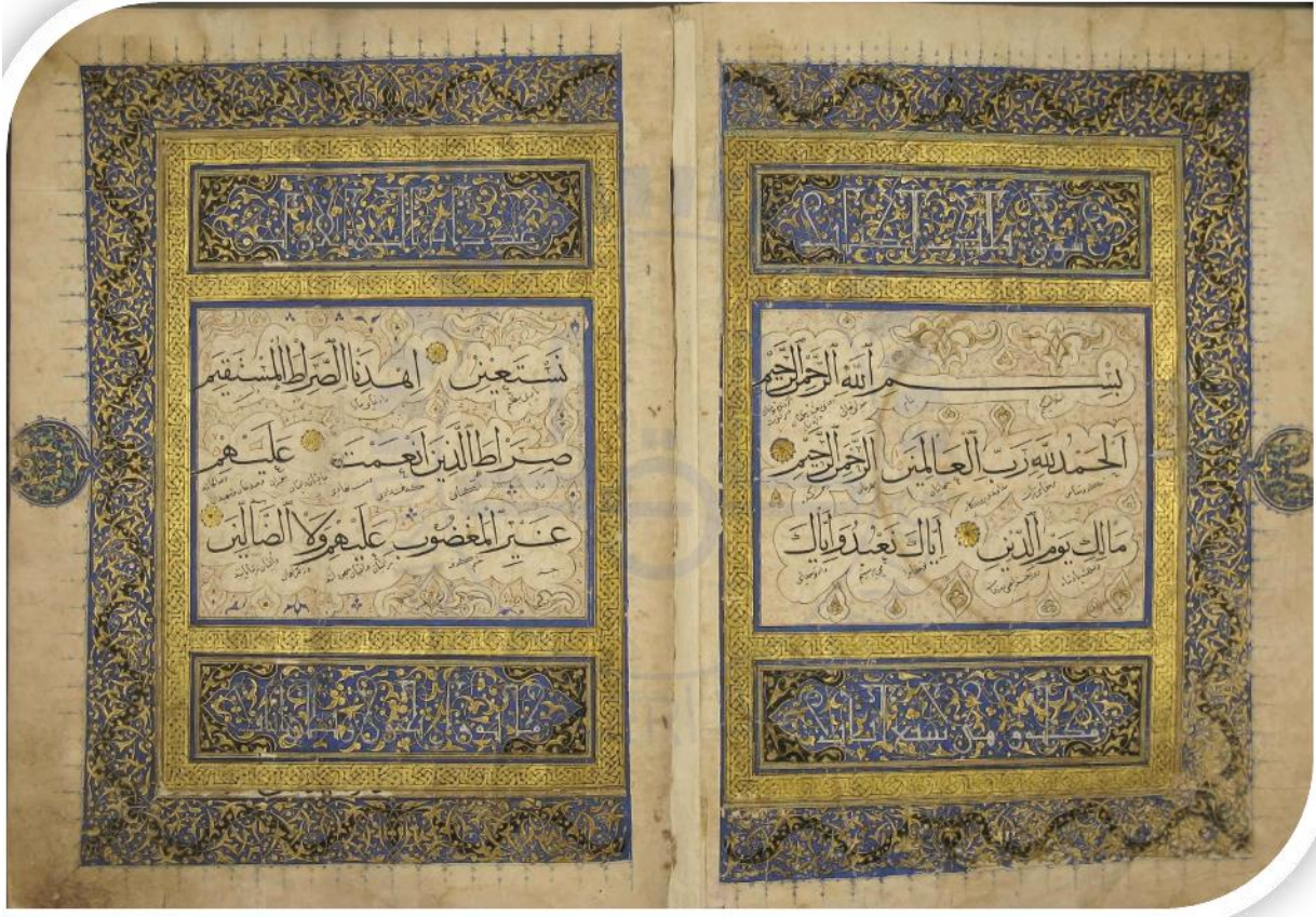
Resim 3: 000598 Envanter nolu Kur'an-ı Kerim'in Serlevha Sayfası (DİB).

1b ve 2a varlığında çift sayfa olarak ilkil tezhip düzeni ile bezenen serlevha'nın yazı kısmı tezhibi tahrirli iki altın kuzunun arasında lacivert renk cetvelle çevrili 1b varlığındaki kare formda yazı alanına Fatiha suresinin bir ve ikinci ayetlerinden sonra üçüncü ayetin başlangıcı yazılmış olup pençhane durak tezyinatına uygun olarak sağ yöne doğru dönen ve merkezde buluşan penç motifini andıran altın zemin üzerine kahverengi mürekkep ile on bir adet sade rumi ile bezenmiş olup uçlarına lacivert renk noktalar konulmuştur. Yazının etrafı dendanlarla çevrilerek boşta kalan kısımlara orta bağ içerisinden iki yana açılan sade rumiler ile kompozisyon oluşturularak etrafları dendanlar ile çevrelenmiştir. Bu dendanların arasına altınla sık bir şekilde birbirine paralel ve aynı zamanda birbirini kesen çizgiler yapılarak hem zeminin görülmesi sağlanmış hem de üzerlerine yapılan lacivert renkte üç nokta (çintemani) bezemelerinin kendisini göstermesini sağlamış olup beynessur tezhibi bitirilmiştir.