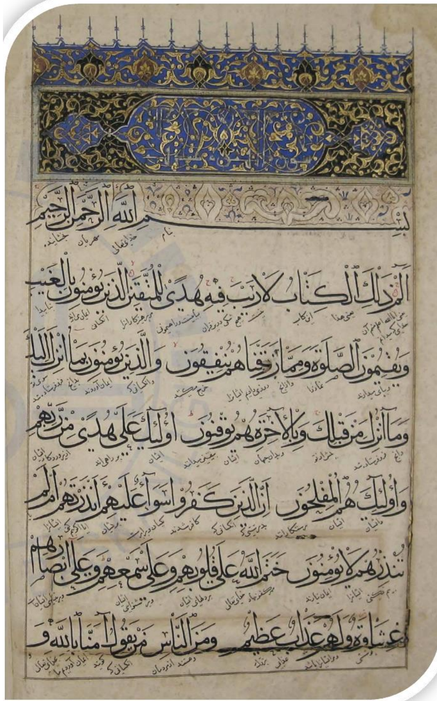
Resim 4: 000598 Envanter nolu Kur'an-ı Kerim'in Sure Başlı Sayfası (DİB).