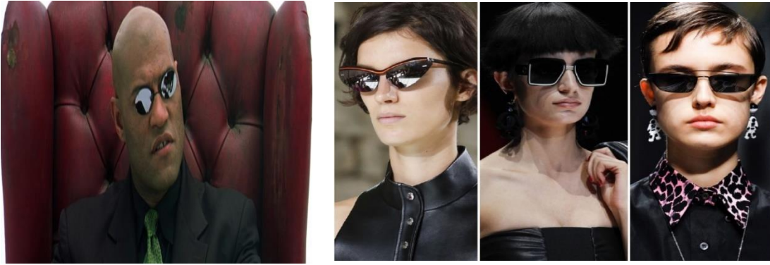
Görsel 5, Görsel 6. Micro Gözlükler, https://fashionone.com.tr , Erişim Tarihi:02-08-2019