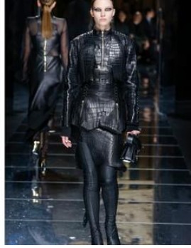
Görsel 11. Balmain, 2017 Sonbahar - Kış Moda Defile Kroko Yüzey Detayları, https://www.highsnobiety.com , Erişim Tarihi: 09-09-2019