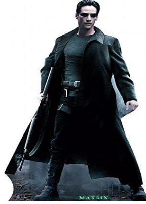
Görsel 4. Neo ve trençkotu, https://www.allposters.com , Erişim Tarihi: 05-05-2019