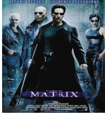
Görsel 1.Larry- Andy Wachowski, Matrix, 1999, Film Afiş, https://www.imdb.com/title/ , Erişim Tarihi: 27-11-2019