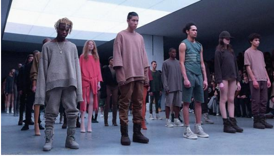
Görsel 9. Kanye West ve Neo Zion dünyasından kazaklarıyla. https://www.much.com , Erişim Tarihi: 09-09-2019