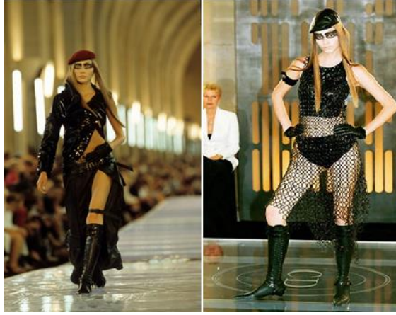
Görsel 7, 1999, John Galliano, Christian Dior Moda Defile https://upost.info , Erişim Tarihi: 19-02-2019

Ünlü tasarımcı John Galliano Matrix filminden etkilenerek defile hazırlayan ilk tasarımcıydı ve arkasından diđer tasarımcılar da onu takip etti. Siyah kuşgözlü paltolar, lastik parlak pantolonlar, yanlı kesilmiş naylonlar, asimetrik kesimler, botlar ve gözlerdeki gözlükler ya da hareketlilik koleksiyona hâkim oldu, Neo'nun atlattığı mermiler modellerin vücutlarındaki ayrıntılarda gözlemlendi (Görsel 7). Yeni bin yıla girerken oldukça dikkat çeken bu akım hızlı şekilde kıyafetler üzerinde etkisini gösterdi.