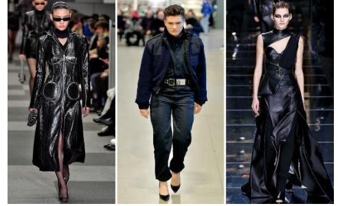
Görsel 10. Kanye West Tarafından Hazırlanan Adidas Original Yeezy Season 1 Çizgisi, 2015. https://www.fastcompany.com , Erişim Tarihi: 09-09-2019