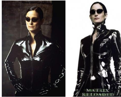
Görsel 3. Trinity, https://www.matrixfans.net , Erişim Tarihi: 05-05-2019