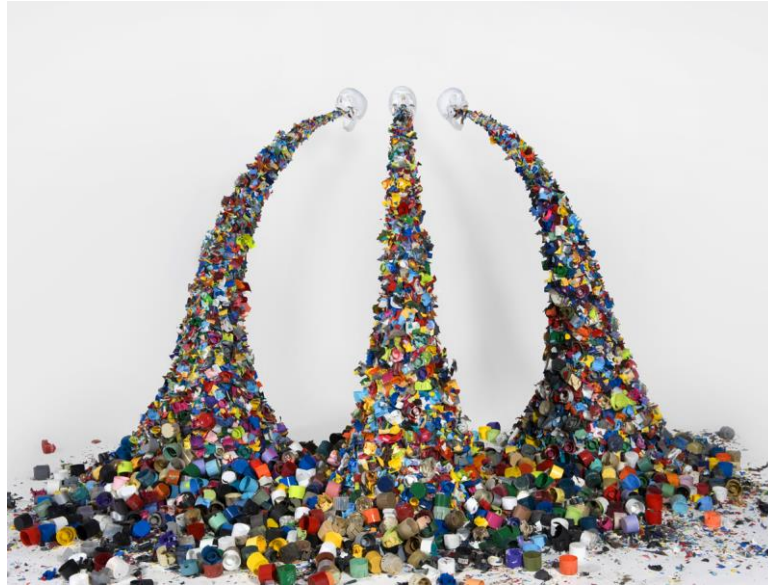
Resim 5. Typoe, "Confetti Death".

Mona Hatoum'un 2002 tarihli "Grater Divide" isimli çalışmasında bir seperatöre dönüşen rende formu, kadının toplumsal ve sosyal alandan soyutlanmış durumunun bir metaforu şeklindedir. Kadının sosyal ve toplumsal hayatta karşılaştığı ve maruz kaldığı sorunlara yönelik birçok mesajı içeren bu çalışma, kadınların özellikle geri kalmış toplumlarda sosyal hayattan uzak tutulmaya çalışılması, kadına biçilmiş olan sadece ev işleri ile sınırlı olan toplumsal role duyulan tepki paravan ve rende birlikteliği ile ifade edilmiştir.