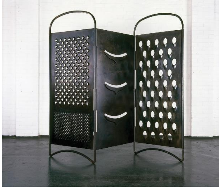
Resim 6. Mona Hatoum, "Grater Divide".

boyutlarıyla oynamaktır. Mona Hatoum'un "Grater Divide" isimli çalışması, normal boyutlarından çok daha büyük bir ölçekte dökme çelikten yapılmış bir rendeden oluşmaktadır. Burada birincil olarak nesneye estetik bir endişeyle müdahale edilmediğini, iletilmek istenen düşünceyi etkili bir şekilde ifade etme arzusunun birinci planda olduğunu söylemek mümkündür. Sanatçı nesnenin sadece boyutunu değiştirerek mutfak gereci olan bir nesneyi farklı kavramlarla ilişkilendirmiştir. (Kılıç, Altıntaş, 2016:195).