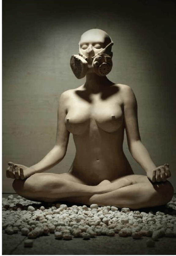
Resim 12. Fatih Şimşek, "Çıplak Maskeli Kadın".

Fatih Şimşek'in "Çıplak Maskeli Kadın" (Resim 12) çalışmasında kadın figüründe kullanılan semboller, daha önceki eserleriyle benzerlik gösterse de bu kez figürün pürüzsüz dokusu dikkat çekmektedir. Kadın figürün lotus pozisyonunda yoga yapıyor gibi durması ruhani arınmayı ve çevresindeki zorluklara karşı direnişini sembolize etmektedir. Sanatçı kadınların konumunu, kimi zaman özgürlüğün, kimi zaman da erkekler dünyasının üstünde bir gücün sembolü olarak görmektedir.