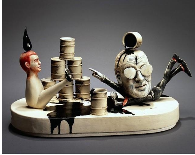
Resim 9. Patti Warashina, "Oil Slick".

Amerikalı sanatçı Patti Warashina, 2004 yılında yapmış olduğu "Drunken Power" serisinde dünyayı karışıklığa sürükleyen silah, kumar ve dünya petrol baronlarını esprili fakat bir o kadar kaotik metaforlar oluşturarak yansıtmayı amaçlamıştır. Warashina bu serinin bir parçası olan "Oil Slick" (Resim 9) isimli eserinde, petrokimya şirketlerinin insanlığı tehdit etmelerine bir gönderme yapmaktadır. Sanatçı çalışmasında bu durumun oluşturduğu kaygan zemin karşısında düşen yada elleri kolları bağlı olan figürlerle metaforik bir anlatım dili yaratmıştır.