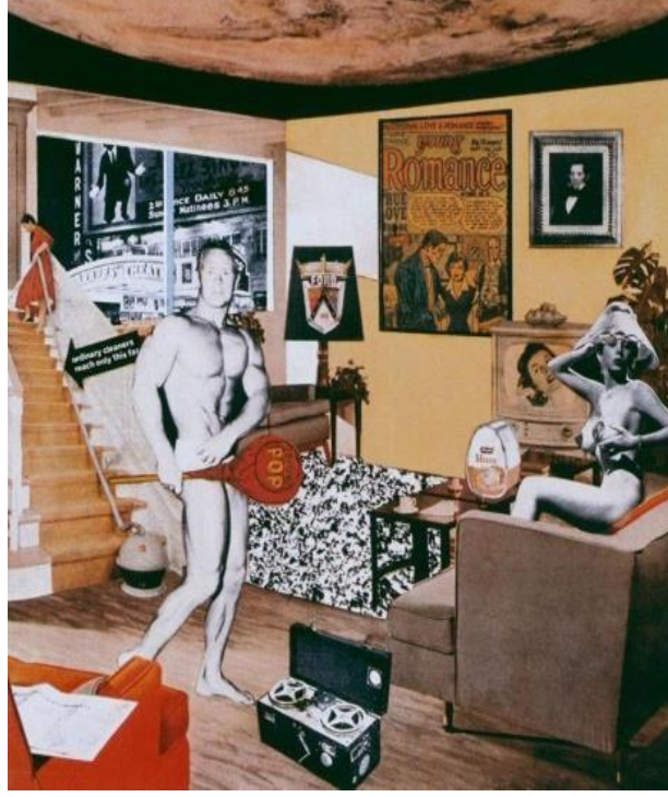
Resim 1. Richard Hamilton, "Just What Is It That Makes Today's Homes So Different, So Appealing".