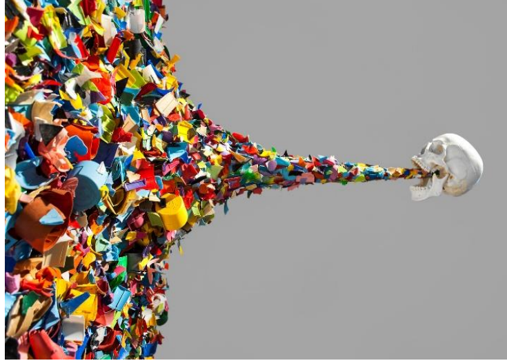
Resim 4. Typoe, "Confetti Death".

kurulmuş olan ironik yaklaşım izleyiciyi zıtlıklar arasında bir sorgulamaya davet etmektedir.