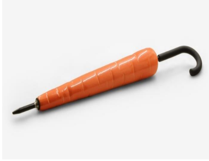
Resim 8. Richard Slee, "Carrot".

Amerikalı sanatçı Patti Warashina, 2004 yılında yapmış olduğu "Drunken Power" serisinde dünyayı karışıklığa sürükleyen silah, kumar ve dünya petrol baronlarını esprili fakat bir o kadar kaotik metaforlar oluşturarak yansıtmayı amaçlamıştır. Warashina bu serinin bir parçası olan "Oil Slick" (Resim 9) isimli eserinde, petrokimya şirketlerinin insanlığı tehdit etmelerine bir gönderme yapmaktadır. Sanatçı çalışmasında bu durumun oluşturduğu kaygan zemin karşısında düşen yada elleri kolları bağlı olan figürlerle metaforik bir anlatım dili yaratmıştır.