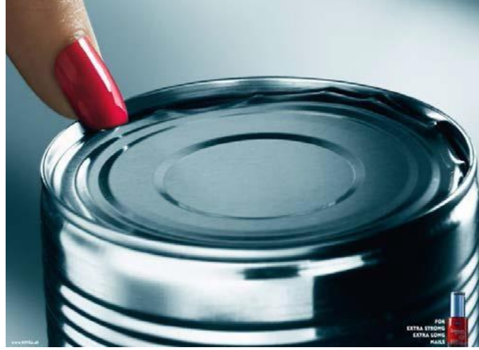
Resim 2. Kozmetik Firması İçin Yapılan Reklam Çalışması.

Reklam ve grafik tasarım alanlarında imajları birleştirerek metaforik anlatımlara benzer tasarımlar, farklı alanlarda da ortaya çıkmıştır. Örneğin El Roto'nun "La Gran Droga" (Resim 3) adlı çalışmasında, "Şırınga", "Televizyon kulesi" ile birleştirilerek bir karikatür çizmiştir. Bu karikatürde "Şırınga" uyuşturulma eylemini "Televizyon kulesi" ise uyuşturucuları temsil etmektedir. El Roto şırınga ve televizyon kulesi imgeleri ile oluşturmuş olduğu metaforik anlatım dilinde, kitle iletişim araçlarının toplumu uyuşturduğuna dair bir farkındalık yaratmıştır.