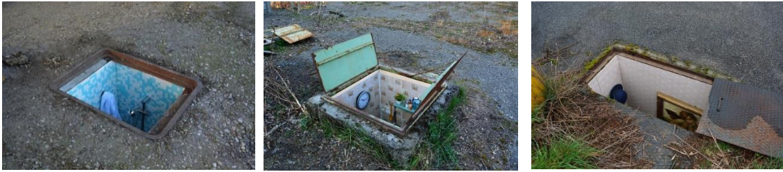
Resim 2,3,4: Biancoshock, "Borderlife", Lodi-Milan, 2016, 1,03x1,00 mt.; 0,65x0,56 mt., 1,10x0,85 mt., Mixed Media

Biancoshock İtalyan bir sanatçıdır. Grafiti dünyasındaki deneyimleri, sanatsal eylemlerini gerçekleştireceği altyapının hazırlanmasına sebep olur. Teknik, malzeme ve konu olarak birbirinden farklı, bağımsız kentsel enstalasyonlar gerçekleştirir. Hepsinde amaç aynıdır: Harekete geçiren bir başlangıç noktası sunmak. Bunu da kişinin günlük rutinini duysal olarak rahatsız etmeye çalışarak ve harekete geçirerek yapmaktadır.