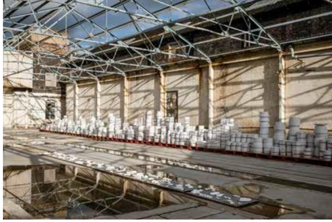
Resim 6: Neil Brownsword, "Externalising the Archive", Jubilee Fırın alanı, Eski Spode Fabrikası, 2019.

eleştiri olarak ele alır; aynı zamanda izleyiciyi mekan içerisinde semboller ile yüzleştirir. Bu bakımdan eser, izleyici katılımını gerekli kılarak izleyiciyi fikrinsel olarak düşündürür.