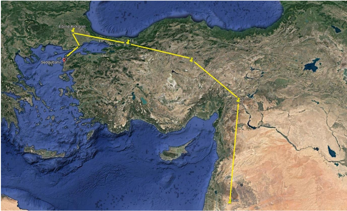
Resim 1: 10. Piyade Tümeni'nin Sina'dan Kırklareli-Edirne'ye ardından Çanakkale Cephesi'ne yürüyüş güzergâhı

Güney Grubu Komutanlığı bölgesinde Soğanlıdere mıntikasında ordugâhını oluşturan 10. Tümene bağlı birlikler