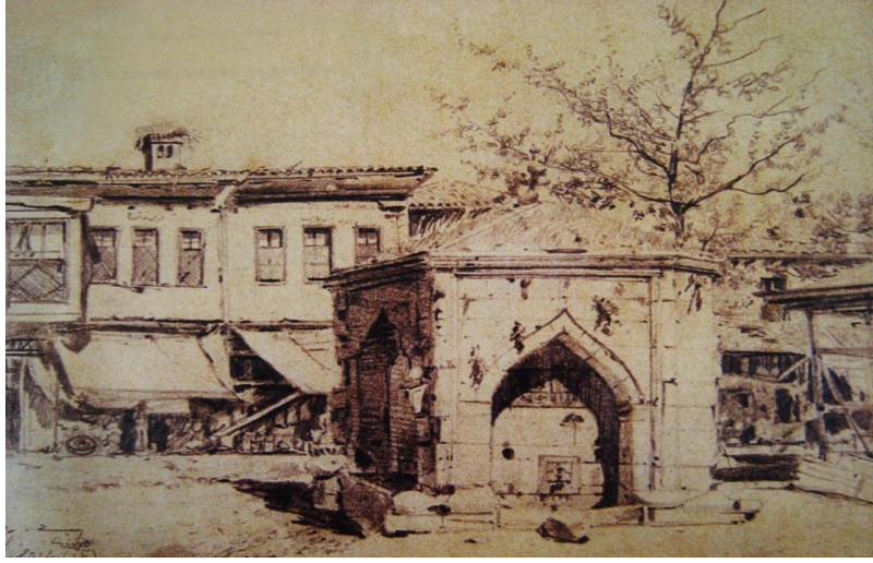
Resim 3. Hoca Ali Rıza, 17 x 24 cm., Kâğıt üzerine karakalem

Hoca Ali Rıza ışığın etkilerini objelere hacim verebilmek için etkili bir dil aracılığıyla vermektedir. Günün farklı saatlerindeki ışık etkilerinin, evler, sokaklar, ağaçlar ve figürler üzerindeki etkilerini detaylı bir şekilde araştırarak etüt etmektedir. İstanbul'un sokakları, kahvehanelerinin resimlendiği eserler yaşanan zamanın kültürüne de kaynak olarak dönemin objeleriyle detay ve görünümüne de dikkat çekerek ışık tutmaktadır.