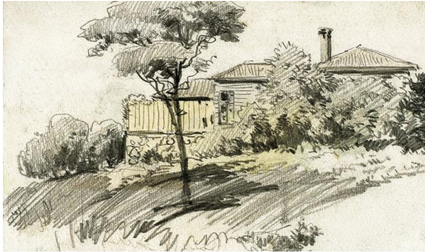
Resim 1. Hoca Ali Rıza, 12 x 17 cm., Kağıt üzerine karakalem, Yapı Kredi Resim Koleksiyonu

Işık ve gölge ile ayrıntılara eserlerinde sıkça yer veren Hoca Ali Rıza realist özellikler gösterdiği eserleriyle realizmin öncüsü olan Gustave Courbet ve Cormon özellikleri göstermektedir. Manzara resimlerinde görülen figürler ise ayrıntıdan uzak resimde perspektife bağlı olarak bir görev üstlenmektedir. Resimlerde yer alan öğelerin konumlandırılışı birbirleriyle olan ilişkisi dikkatli bir şekilde kompoze edilmiştir. Peyzajlarda yer alan ev ya da köşkler, ağaçların konumlandırılmasına kadar birçok detay düşünülmüştür.