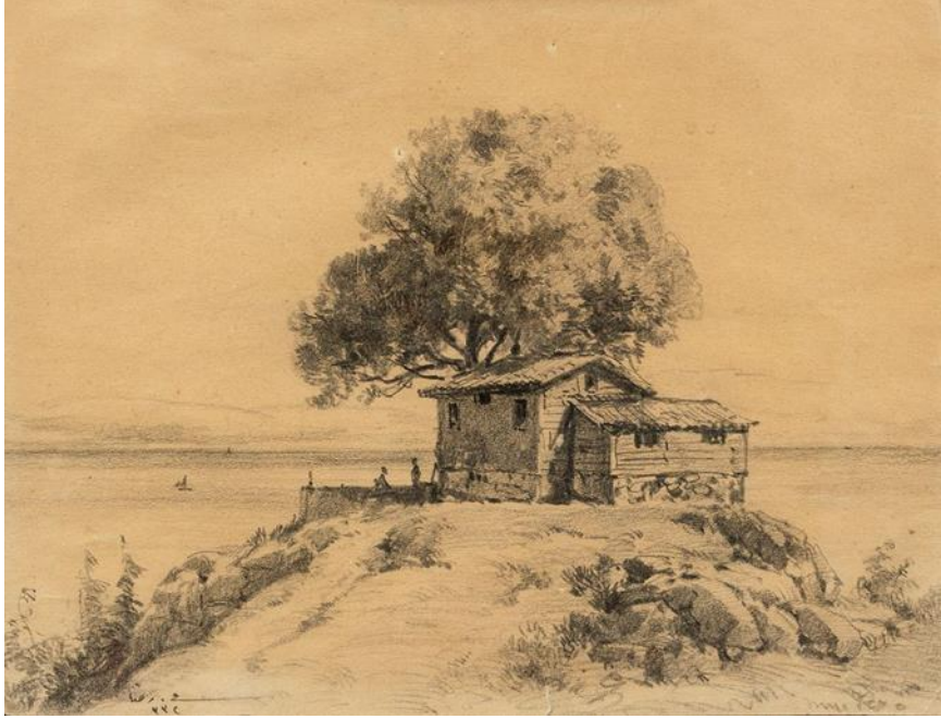
Resim 2. Hoca Ali Rıza, "Sahilde Ev", 18,5 x 24,5 cm., İmzalı, (1)332 hicri (1916) tarihli, Kağıt üzerine karakalem

Sezer Tansuğ'un da belirttiği gibi Hoca Ali Rıza'nın doğal gün ışığına duyarlılığı ise, bağlı kaldığı bazı form ve özelliklerden ötürü daha ılımlı bir değişimin niteliğini yansıtır (Tansuğ, 1997: 137).