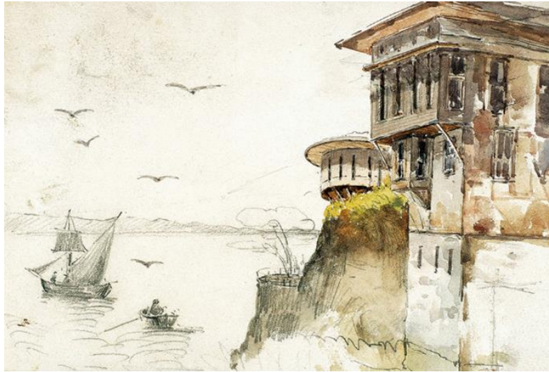
Resim 6. Hoca Ali Rıza, “Yalılar ve Yelkenli”, Karışık teknik

İstanbul doğasından esinlenmek, özellikle 1914 Kuşağı sanatçıları açısından ihmal edilmez bir eğilimdi. Doğal güzelliklerle tarihsel değer taşıyan anıtların iç içe konumlandığı, birinin ötekini tamamladığı bir ortamda, güneş ışınlarının çarpıcı etkisi altında, sanatçı gözleminin süreklilik arayışından daha doğal bir şey olamazdı. Kasımpaşalı Hilmi'den Eyüplü Cemal'e, Halil Paşa'dan Hoca Ali Rıza'ya, Hikmet Onat'tan Nazmi Ziya'ya uzanan bir çizgi üzerinde, İstanbul'u semt semt yansıtan manzara resimleri, bu tükenmez gözlemin ürünleri olarak çıkar karşımıza (Özsezgin, 2000: 19).