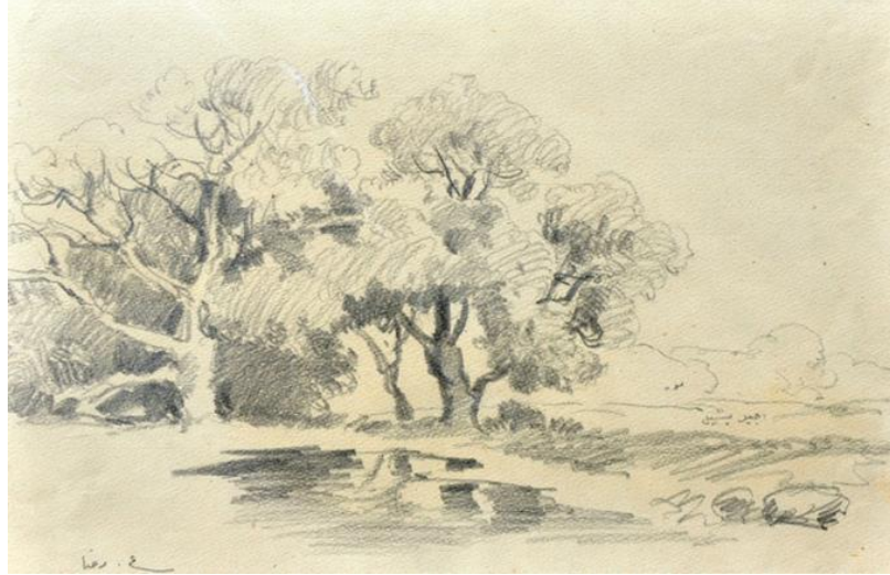
Resim 4. Hoca Ali Rıza, "Çeşme", 26/37cm, kağıt üzerine karakalem, Özel Koleksiyon

Türk resim sanatı tarihi açısından oldukça önemli bir isim olan Hoca Ali Rıza, yaşadığı dönemi resimlerinde belgelemeyi amaç edinmiştir. Özellikle gözleme dayalı kent görünümleri, sokak görünümleri ya da doğrudan anıtsal mimarlık örnekleri olarak kent ve mimarlık tasarımları açısından resimleri ayrıcalıklı bir değere sahiptir. Geçmişten günümüze değişen kent dokusunda da sanatçının resimleri, özellikle 19. yüzyıl sonu ve 20. yüzyıl başından vefat yılı olan 1930'a kadar olan süreçteki görünümleri aktarması açısından belgesel değer taşır (Sarıdikmen, 2019: 299).