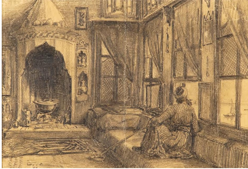
Resim 5. Hoca Ali Rıza, Enteriyör, 1911, Karakalem çalışması

Hoca Ali Rıza'nın resimlerinde sıklıkla ele aldığı İstanbul'un çeşitli semtlerindeki birçok mahalle ve sokak da o dönemin toplum yaşantısı, sokak kültürü, mimari yapısı hakkında bilgi edinmemizi sağlayarak dönem ruhunu yakalamamıza yardımcı olmaktadır. İstanbul'un ahşap evlerden oluşan dar ara sokakları, inişli çıkışlı yolları, şehrin merkezinden uzakta olan sessiz sakin köşeleri Hoca Ali Rıza'nın ustalıkla desen çizimleri ile fotoğraftan öte bir gerçekliğe bürünmektedirler. Tüm bu çizimlerinde görünümüler Hoca Ali Rıza'nın bakış açısı ve dünya görüşü doğrultusunda Türk-Osmanlı yaşam tarzını yansıtmakta onun bakış açısı doğrultusunda biçimlenerek vücut bulmaktadır (Pehlivan, 2018: 156).