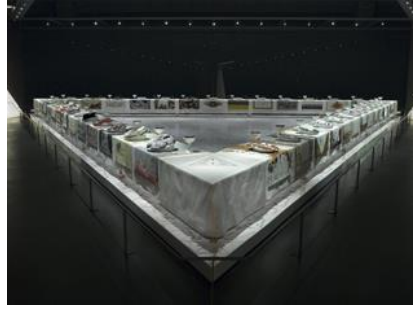
Şekil 5. Judy Chicago, The Dinner Party, enstalasyon genel görünüm,