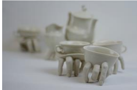
Şekil 7. "Time For Tea", 2015, porselen, New Taipei City Yingge Ceramics Museum.