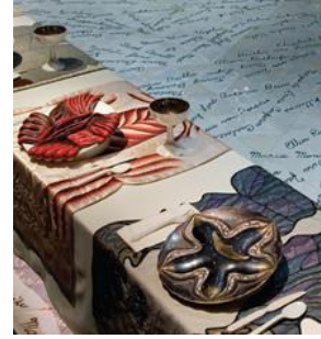
Şekil 6. Judy Chicago, The Dinner Party, enstalasyon detay,