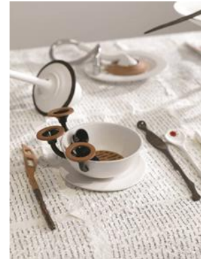
Şekil 15. "Kayıp Akşam Yemeği" detay, paslanmış testereden bıçak.

Masada bulunan nesnelere birliktelikleri tasarlanarak bir araya getirildikleri ve böylece insanı düşündürdükleri yadsınmaz bir gerçektir. Birbirine kelepçelenmiş tuzluk ve karabiberlik... (Şekil 13) Nasıl ki sofrada tuz ve karabiber ayrılmaz bir bütündür, ataerki aile yapısında o ailenin fertleri de ayrılmaz bir yapının parçası olduğu gibi 'Kayıp Akşam Yemeği'nde birbirine kelepçelenmiş tuzluk ve karabiberlik formu ile geleneksel aile yapısının bütünlüğüne atıfta bulunulmaktadır. Yeri geldiğinde yemek pişiren, yeri geldiğinde temizlik yapan geleneksel kadın rolüne atıfta bulunan ortasında lavabo gideri bulunan bir kase (Şekil 14), hayatını bu geleneksel yaşamın içinde paslanmaya mahkum eden kadını temsil eden paslanmış testereden bıçak (Şekil 15) ile toplumda kadının yerini eleştirel ve ironik bir dille yansıtmaya çalışmıştır. Bütün detaylarda göze çarpan ve geleneksel kadının rolünü sorgulatan ayrıntılar, Dadaist ve Sürrealist bir anlatım biçimiyle bu eserde de karşımıza çıkmaktadır.