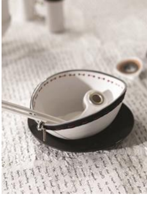
Şekil 10. "Kayıp Akşam Yemeği" detay, fermuarlı tabak.