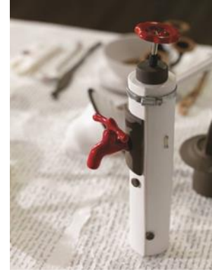
Şekil 12. "Kayıp Akşam Yemeği" detay, musluklu sürahi.

Fermuarlı bir tabak (Şekil 10), kırpikli bir yumurtalık (Şekil 11), musluklu bir sürahi (Şekil 12) ve alışılmışın dışında el yazması bir örtü. Bayrak'ın kişisel web sitesinde de belirttiği gibi bu eserde, işlev, simge, kavram ve anlamların ötesine geçerek, tuhaf ve bir o kadar güçlü objeleri Dadaist ve Sürrealist çağrışımlar ile birleştirmeyi başarmıştır. Sanatçı geleneksel nesnelere cinsiyet ve kimlik kazandırarak cinsel ayrımcılığa da ince bir gönderme yapmaktadır.