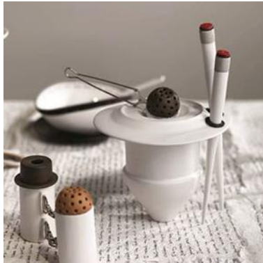
Şekil 13. "Kayıp Akşam Yemeği" detay, kelepçelemiş tuzluk ve karabiberlik.

Fermuarlı bir tabak (Şekil 10), kırpikli bir yumurtalık (Şekil 11), musluklu bir sürahi (Şekil 12) ve alışılmışın dışında el yazması bir örtü. Bayrak'ın kişisel web sitesinde de belirttiği gibi bu eserde, işlev, simge, kavram ve anlamların ötesine geçerek, tuhaf ve bir o kadar güçlü objeleri Dadaist ve Sürrealist çağrışımlar ile birleştirmeyi başarmıştır. Sanatçı geleneksel nesnelere cinsiyet ve kimlik kazandırarak cinsel ayrımcılığa da ince bir gönderme yapmaktadır.