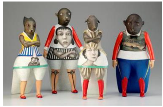
Şekil 3. Sergei Isupov'a ait seramik heykeller.