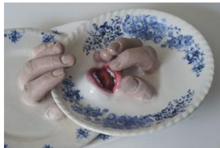
Şekil 8. "Breakfast", 2014, Porselen, 14th Biennial of Ceramics, Andenne, Belçika.

Judy Chicago'nun 'The Dinner Party' adlı eseri ile Yeşim Bayrak'ın 'Kayıp Akşam Yemeği' eseri konuları, konuyu ele alma biçimlerinin enstalasyon olması ve isimleri açılardan benzerlik gösterirken, Ronit Baranga'nın eserleri ile daha çok üslup açısından benzerlik göstermektedir. Bu sanatçılar duygu ve düşüncelerini aklın, geleneklerin, görünen gerçeğin dışında bilinçaltının gerçeğinin yansıtan Dadaizm ve Sürrealizm anlayışıyla aktarmışlardır. 'Time For Tea', 'Breakfast', 'The Feast', 'Self Feeding', 'Crowd', 'Tea Party' serilerindeki tabak, fincan, çaydanlık gibi yemek servisinde kullanılan ürünleri insana ait uzuvlar ve organlarla birleştirerek, işlevlerini dışlayarak sanat eserine dönüştürmüş ve esere ait çözümlenmeyi izleyiciye bırakmıştır (Şekil 7-8).