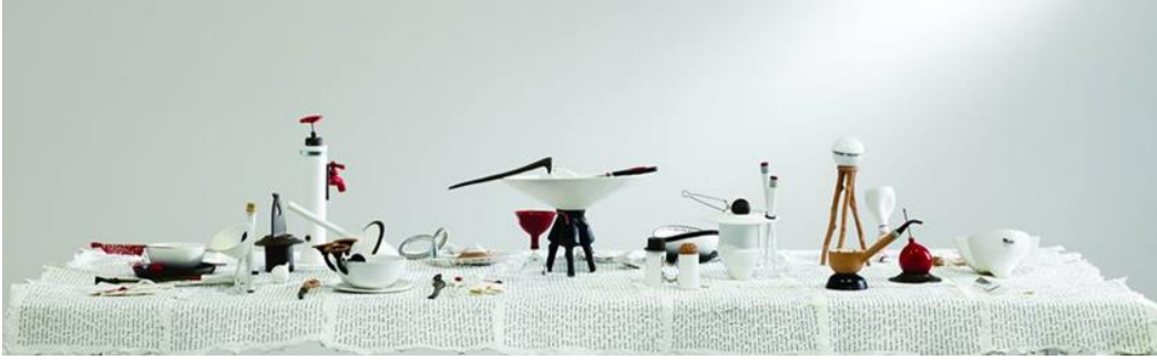
Şekil 9. "Kayıp Akşam Yemeği" (Lost Dinner), 2013, 2,50x100 porselen, metal, ahşap, el yapımı kâğıt, enstalasyon

Duchamp ile başlayan endüstri ürününün sanat eserine dönüştürülmesi (Yılmaz 2006:114), bir anlamda sürrealist seramikçilerin de hazır nesneyi kullanarak Dadaist ya da Sürrealist yaklaşımları olan eserler üretilebilmelerine katkı sağlamıştır. Ufuk Tolga Savaş nesne dönüşümlerini dört şekilde kategorize etmektedir. Endüstri ürünü nesnenin sanat eserine dönüşmesi; nesnenin yapıldığı malzemeyi, boyutlarını, bağlamını değiştirerek, ya da endüstri ürünü nesnenin özünü değiştirmeden, şeklinde küçük değişiklikler yaparak yeni bir nesne yaratmak şeklinde olabilir. 'Kayıp Akşam Yemeği' eseri açısından burada üzerinde duracağımız dönüşüm; endüstri ürünü nesnenin özünü değiştirmeden, şeklinde küçük değişiklikler yaparak yeni bir nesne yaratmak olacaktır. "Endüstri ürünü bir nesnenin şekline işlevini yok edecek yönde sınırlı bir müdahale yapılacak olursa, o nesne gündelik göstergesinden sıyrılacak ve yeni bir nesne olarak ortaya çıkacaktır" (Savaş, 2007). Böylece sıradan ya da gündelik bir nesne yeni bir biçim diliyle yeniden var olarak sanat eserine dönüşmüş olacaktır.