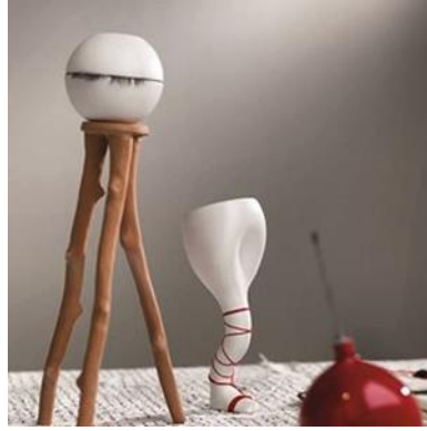
Şekil 11. "Kayıp Akşam Yemeği" detay, kırpikli yumurtalık.