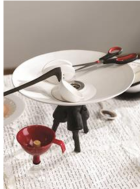
Şekil 14. "Kayıp Akşam Yemeği" detay, lavabo gideri bulunan kâse.