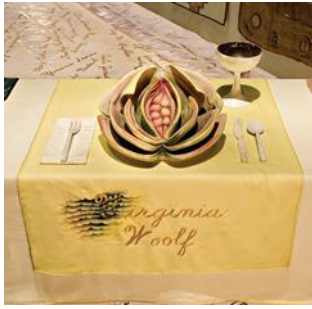
Şekil 4. Judy Chicago, The Dinner Party, enstalasyon detay,