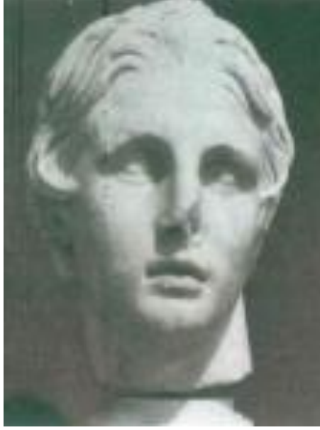
Resim 1. Büyük İskender'in Baş, Bergama, MÖ 2. Yüzyıl. İstanbul Arkeoloji Müzesi, İstanbul.

Sanatçı sahte bir özgürlük havasına kapılmadı. O da kendini sosyal muazzam bir imparatorluğun parçası gibi gördü. Kültürel cephede kendine yer buldu. Gerçeklik terminolojisine bağlı kalan ve onu yorumlayan Helenistik sanatçı insani tüm boyutlarıyla almaya başladı Helenizm sanatta yeni bir farkındalık yaratarak yeni bir döneme damgasını vurdu.