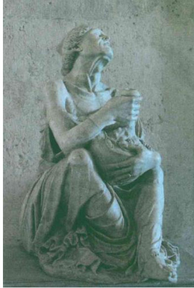
Resim 2. Yaşlı Sarhoş Kadın, yak. MS 3. Yüzyıl. Capitolini Müzesi, Roma.

Resim 1'de görülen İskender'in Büstü adlı eser Helenistik yontularının özelliklerini kendinde toplayan bir çalışmadır. Çok kültürlü bir yapının ağırlığını kaldırmak Helenistik sanatçılara düşmüştü. Sanatçının mükemmel varan anlatım gücünü klasik Yunan sanatından ayıran İskender Büstüdür. İskender Büstü incelendiğinde çok anlamlı en dipten gelen tinsel bir bakışı görmek mümkündür. Sanatçının büyük ustalık gösterdiği yapıt, insani özellikleri ile kendini açığa vurur. Saçlardaki ayrıntı, gözlerdeki anlamlı bakış, İskender'in kendinden emin, saygın duruşu, Asya'nın Fatih'i olduğunu ifade eder gibidir. Sanatçı o dönemde ortak kabul edilmeyen bir sanat geleneğini başlatmış, zihinsel tutkuların taşa hayat bulduğu heykeller Helenistik sanatının zenginliğini gözler önüne sermiştir