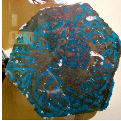
Resim 15. Geyik motifli bir çini. (Erdem, 2017)