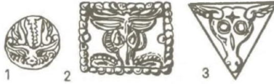
Resim 4. Altay Hun çağı kurganlarına ait geyik-demonlar. (Ögel, 2010: 576)