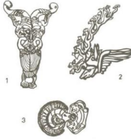
Resim 2. Altay Hun çağı kurganlarında bulunmuş, ağaçtan yapılmış figürler. (Ögel, 2010: 572)

Milattan önceki devirde muhtelif göçebe çevrelerinde bulunan ve "geyikli taş" diye anılan, alp mezarı olduğu sanılan taşlar da Uluğ Kem vadisinde mevcuttu. Bunların alp mezarı olduğu, üzerlerindeki ok, yay, kama, balta gibi silah resimlerinden ve mertebe işareti olduğu Kök-Türk devri kitabelerinden bilinen "kur" (kemer) tasvirinin mevcudiyetinden anlaşılmaktadır (Esin, 2002, 727).