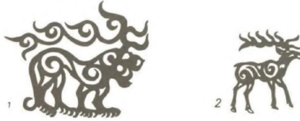
Resim 3. Altay Hun çağına ait 1. Tuyahta kurganında bulunmuş geyik, arslan veya kaplan-geyikler. (Ögel, 2010: 574)