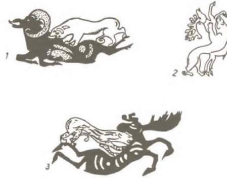
Resim 7. Altay Hun çağı Pazırık kurganlarında bulunmuş geyik ve kaplan mücadeleleri. (Ögel, 2010: 580)

Geyiğin Orta Asya'daki av hayvanı rolü, saray ve av eğlencelerinin konu edinildiği Anadolu Selçuk figür sanatında da devam etmiştir. Selçukluların, ataları Oğuzlardan kalan bir gelenek olarak sürdürdükleri bu av merasimlerinde avlanan başlıca hayvanlardan biri geyikti. Bu merasimlerin içerisinde önemli bir rol oynayan geyik haliyle Anadolu Selçuk figür sanatının da başlıca motiflerinden biri haline gelmiştir. Ancak geyik her ne kadar Türklerin av kültüründe önemli bir yere sahip olsa da koruyucu, yardımsever ve kutsal sayılmasından dolayı tarihte kimi zaman Türk hükümdarları dışında hiç kimse tarafından avlanamayan, avlanması yasak olan bir hayvan olarak kabul edilmiştir.