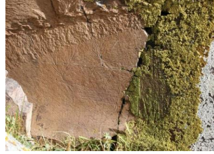
Resim 6. Tunçkaya Kaya Panoları (Ceylan, 2014)