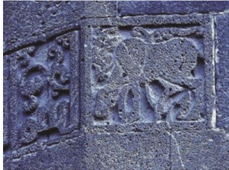
Resim 9. Tek Beden'deki küfi kitabenin başında yer alan geyik figürü (Kanay vd. 2017)