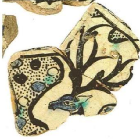
Resim 10. (Arık, 2007: 267)