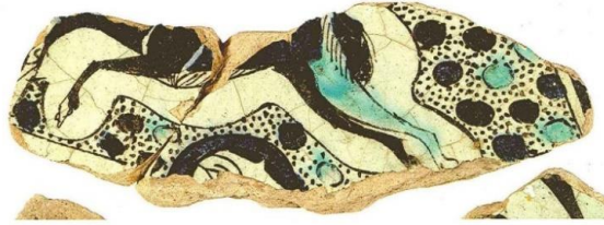
Resim 13. (Arık, 2007: 267)