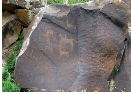
Resim 5. Kömürlü Kaya Panoları (Ceylan, 2014)