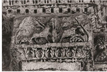
Resim 8. Ulu Cami (Kanay vd. 2017)

"Daha seyrek ve nadir olsa da Anadolu'da da bu tür mimarinin örneğine rastlanıyor ve yine geyik figürleri bol bulunan Tokat yöresinde de görülmektedir" (Uçar, 2014)