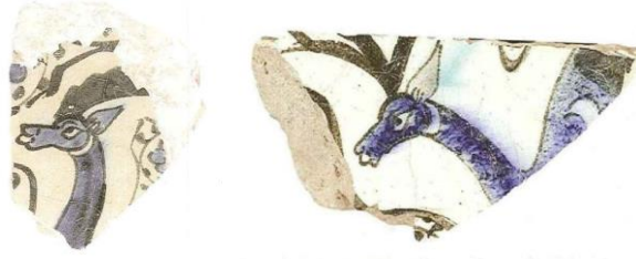
Resim 11. (Arık, 2007: 323)