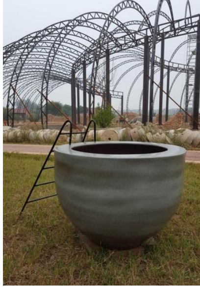
Resim 10. Umut Serisi düzenleme

Farklı malzeme kullanımını sanatçı açısından yapıta zenginlik ve çeşitlilik katmaktadır. Bu süreçte, seramik ile birleştirme problemlerini de beraberinde getirmektedir. Ancak sanatçı bu tavrı bireysel ve deneysel bir üslup ile eserlerinde ustalıkla çözümlenmektedir.