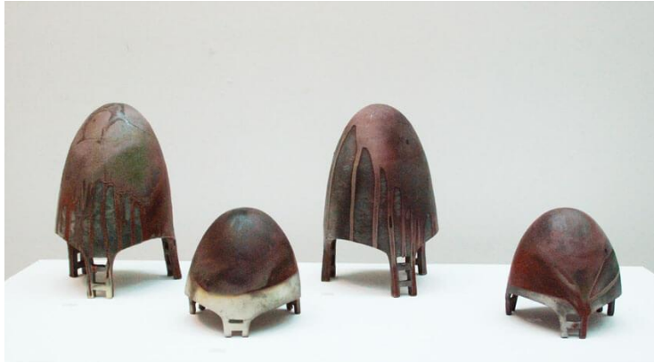
Resim 9. Umut Serisi düzenleme

Bu merdivenlerin nereye indiği, nereden çıktığı, nereye ulaşmaya / ulaştırmaya çalıştığı belirsizdir. İzleyen nasıl gördüğüyle ilgili, izleyene bağlı bir durumdur. Bazı çalışmalarda merdivenler formun çevresine sarılmakta, bazısında bir noktada sıfırlanmaktadır. Her iki durumda da başı sonu tanımsızdır... Başkaya merdivenli eserlerini tanımlarken, "Umut da olabilir umutsuzluk da ama benim için umut. Çünkü günlük politikaların insanlar üzerinde yarattığı mutsuzluk / umutsuzluk, küçük hayallerle umuda dönüşebilir." İfadelerini kullanmaktadır.