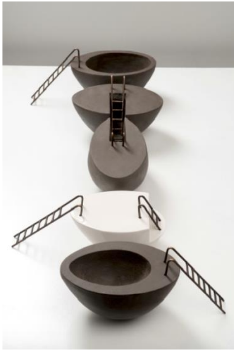
Resim 7. "Umut" serisi, düzenleme, 250 X 50 cm.

Özellikle toplumsal eleştirileri ile seramiğe farklı bir boyut kazandıran Başkaya, kavramsal içerikli eserlerine "Umut" serisini sıklıkla kullanarak devam etmektedir. Bu eserleri için Başkaya, "Günlük politikaların insanlar üzerinde yarattığı mutsuzluk, iyimser düşünülüğünde küçük hayallerle umuda dönüşebilir. Bu düşünceden hareketle oluşturduğum formlarda merdiven, umudun sembolü; karamsarlığa kapıldığımızda, belirsizliği anlatan merdiven ise aydınlıktan karanlığa doğru gidişin sembolüdür." demektedir (Tatlıcan, 71)