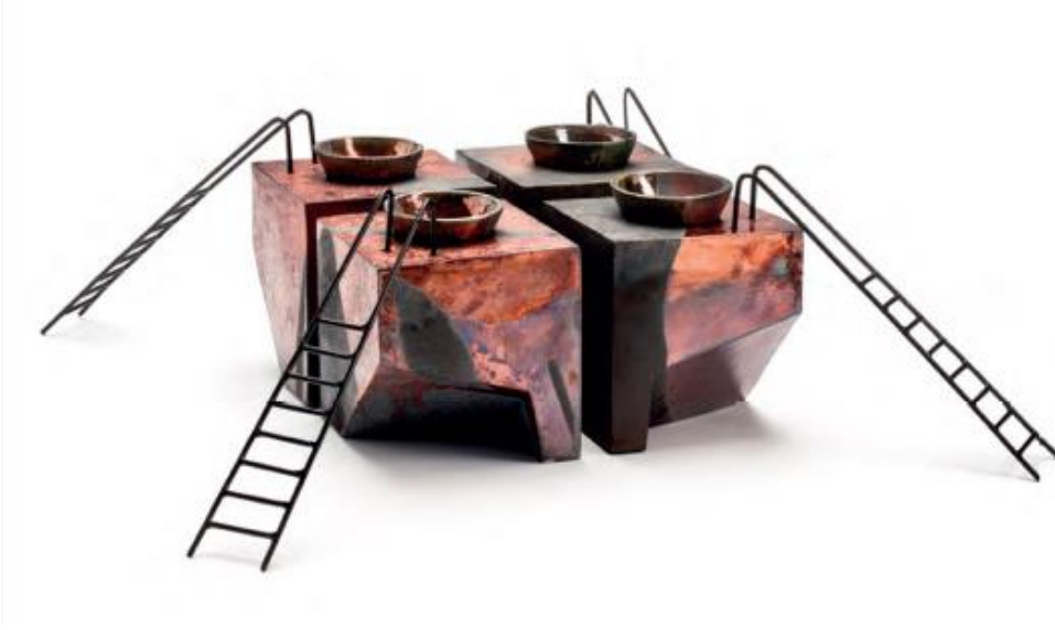
Resim 8. "Umut" serisi, Serbest şekillendirme, Raku pişirimi, 80x80x15cm.

Bu merdivenlerin nereye indiği, nereden çıktığı, nereye ulaşmaya / ulaştırmaya çalıştığı belirsizdir. İzleyen nasıl gördüğüyle ilgili, izleyene bağlı bir durumdur. Bazı çalışmalarda merdivenler formun çevresine sarılmakta, bazısında bir noktada sıfırlanmaktadır. Her iki durumda da başı sonu tanımsızdır... Başkaya merdivenli eserlerini tanımlarken, "Umut da olabilir umutsuzluk da ama benim için umut. Çünkü günlük politikaların insanlar üzerinde yarattığı mutsuzluk / umutsuzluk, küçük hayallerle umuda dönüşebilir." İfadelerini kullanmaktadır.