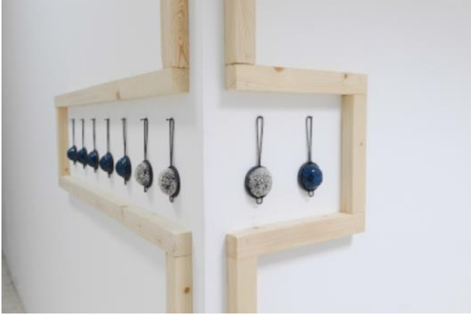
Resim 3. “ Akıl süzgeci” serisi, mısır pastası, yan malzeme; çay süzgeci, ahşap.

Mahalle baskısı üzerine yoğunlaştığı dönemdeki çalışmalarında Hocası Prof._Dr. Hamiye Çolakoğlu’ nun hediye ettiği merdaneyi imge olarak kullanan sanatçı, akıl süzgeci isimli çalışmasında nesne üzerinden hareketle göndermeler yapan Mutlu Başkaya “...aklını bir türlü süzgeçten geçiremeyen birbirinin kopyası gibi var olan insanlar, insancıklar bu yapıtta, en yalın fakat en çarpıcı görünümleri ile sergilenmektedir” (Erinç, 2004). Bu çalışmalarında çay süzgeçlerini, medyatik kirlenme ile ilgili çalışmalarında ise lavabo süzgeçlerini eserlerini kavramsal açıdan güçlendirmek için kullanmıştır.