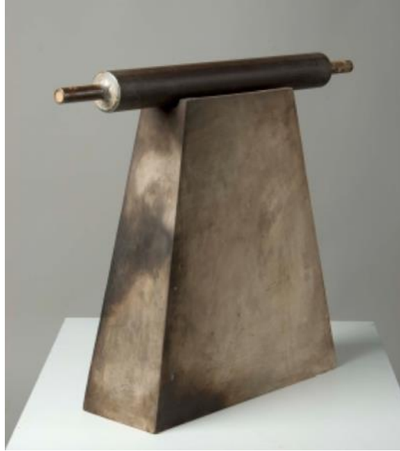
Resim 4. “Baskı”, 2007, isleme, yan malzeme: metal merdane.

Mahalle baskısı üzerine yoğunlaştığı dönemdeki çalışmalarında Hocası Prof._Dr. Hamiye Çolakoğlu’ nun hediye ettiği merdaneyi imge olarak kullanan sanatçı, akıl süzgeci isimli çalışmasında nesne üzerinden hareketle göndermeler yapan Mutlu Başkaya “...aklını bir türlü süzgeçten geçiremeyen birbirinin kopyası gibi var olan insanlar, insancıklar bu yapıtta, en yalın fakat en çarpıcı görünümleri ile sergilenmektedir” (Erinç, 2004). Bu çalışmalarında çay süzgeçlerini, medyatik kirlenme ile ilgili çalışmalarında ise lavabo süzgeçlerini eserlerini kavramsal açıdan güçlendirmek için kullanmıştır.