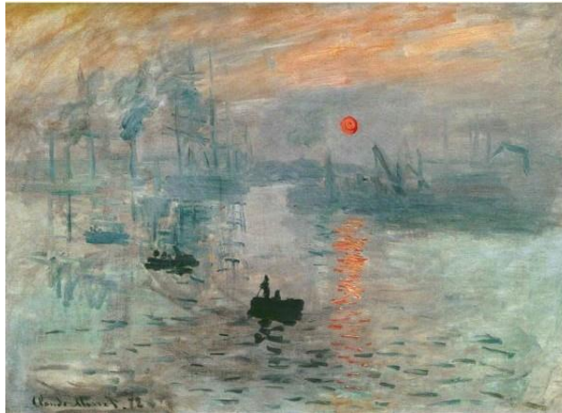
Resim 1: Monet'nin Gün Doğumu