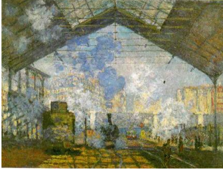
Resim 2: Claude Monet St-Lazare tren garı, 1877

“İzlenim, gündeğümü güneşin Normandiya’daki LaHavre limanının üzerine doğru sisin içinden parlamasıyla, Monet’nin kısacık bir anı yakaladığı biçimsel yenilikçi anlayışın ispatıdır. Sisten dolayı karartı halindeki sandallar ve vinçler gibi gri sabahı vurgulamak için de tek bir renk kullanılır.” (Newall, 2012: 15). Gün doğumu atmosferini iyi bir biçimde ortaya koymuştur. Monet’in bu resmi empresyonizmin ilk örneğidir. Resme bakıldığında anın hızlı fırça vuruşlarıyla cesur bir biçimde verildiği görülür. Resim bitmemiş izlenimi uyandırır. Zaten tepkinin kaynağı da alışılmış sanat anlayışının dışına çıkılmasıdır. Açık havada yapılan bu çalışma empresyonist eserlerin ilk örneğidir.