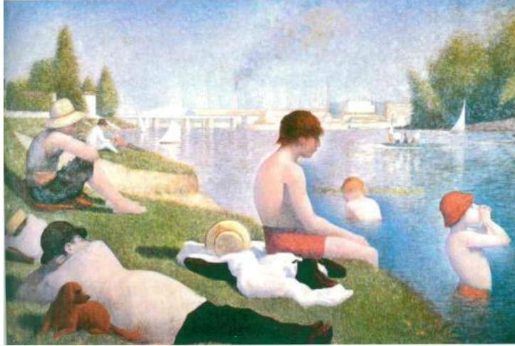
Resim 5: Asnières'de Su Sefası

“Empresyonizm burjuva kapitalizminin 1871-1914 arasındaki uzun kapalı dönemi nde burjuva sanatının parlak bir doruğu, altın gözü, bereketli bir hasadı. Sanatçının elindeki anlatım araçlarının sınırsız bir zenginleşmesiydi” (Fischer, 1995: 74). Empresyonizm bir kasırga gibi sanatta ortaya çıkmış önüne ne çıkmışsa yıkıp savurmuştur. Volkan gibi yok etmiş ama sanatta da çok zengin ürünler sunmuş, sanatın dünyasını çok daha zenginleştirilmiştir. Sanatçı da bu yeni dönemde kendini daha iyi ifade edecek yeni yöntemler geliştirmişti. Empresyonistler çok geniş bir konu yelpazesine sahip olmuş toplumun her çeşit gündelik yaşam tarzını sanatına yansıtmışlardır. Bu yaşam biçimi de kentin kazandırdığı yeni yaşama biçimiydi.