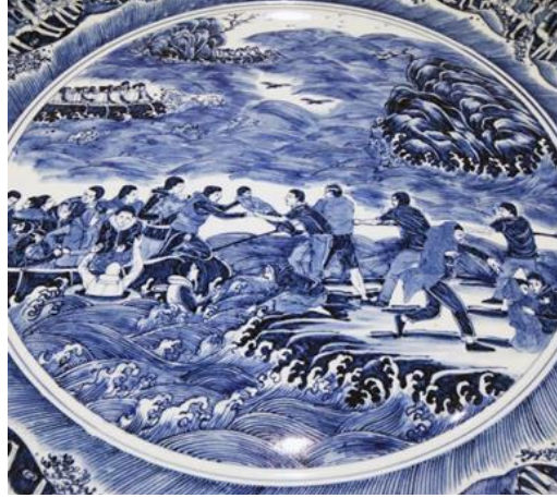
Tablo 2. Ai Weiwei mültecilerin dramını anlatan mavi beyaz porselen tabak.

Porselen eserlerin mülteci meselesi ile bir araya getirilmesinin yarattığı etki, göçmenlerin yaşamış oldukları zorlu süreçleri sanatçının kullanmış olduğu imgelerle gözler önüne sermektedir.