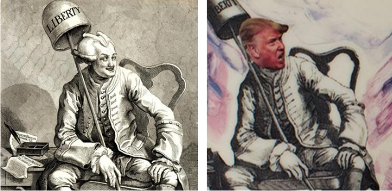
Tablo 9. William Hogarth John Wilkes Gravür baskı 1763.