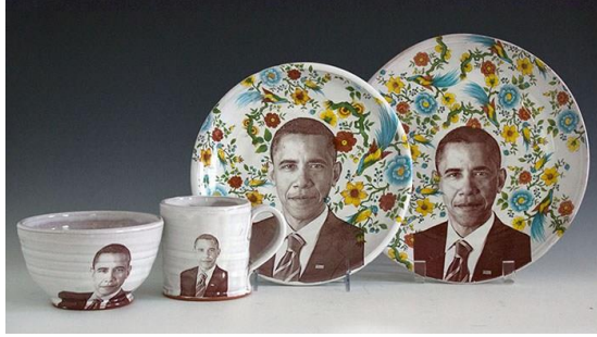
Tablo 4. Ai Weiwei Aylan Kurdi'nin yer aldığı porselen tabak.

Sanatçı siyasilerin portrelerini kullandığı kullanım eşyaların da “ABD’nin tarihinden oluşan seçilmiş hükümet liderlerinin ülkenin yasalarını nesiller boyu şekillendirmelerine, kullanıcıların bu liderleri daha yakından tanımak, siyasete nasıl eğildiklerini, onların neyi temsil ettiklerini, ülkesinde adaletin nasıl şekillendiğine dair bir konuşma başlatmak için bir yol olarak tanımlamaktadır. (Ceramic Monthly May 2014: s.28)