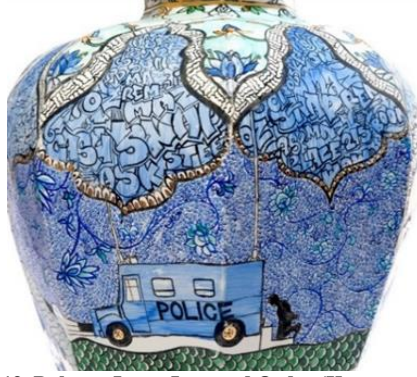
Tablo 13. Roberto Lugo, Law and Order (Kanun ve Emir) 2017.

Sanatçının “Law and Order” (Kanun ve Emir) isimli bir başka çalışmasında, Donald Trump’ın ön yüzünde ve arkada yüzünde ise Frederick Douglass’ın portreleri yer almaktadır. Sanatçının bu zıtlıklarla dolu çalışması şimdiki zamanın efsanevi köleleştirici olarak gördüğü Trump’ın özgürlük ve insan hakları ile ilgili yaptığı gaflara atıfta bulunmaktadır.