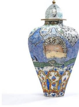
Tablo 12. Frederick Douglass detayı, Law and Order (Kanun ve Emir) 2017.