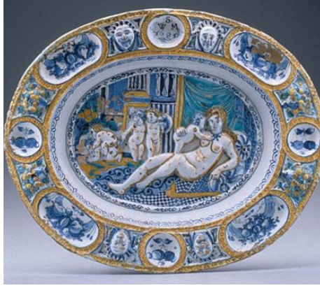
Tablo 6. Bernard Palissy'nin Fecundity Dish (Bereket Tabagı) 1681.

Sanatçının 2008'de tasarlanan Paradise Lost (Kayıp Cennet) isimli eserinin çıkış noktasını bir dizi çağdaş politik yorumda yer alan 16. yüzyıl Fransız çömlekçi Bernard Palissy'nin Fecundity Dish (Bereket Tabagı) isimli mayolika tabağının yapısından ve kompozisyonundan ilham almıştır (Tablo 6).