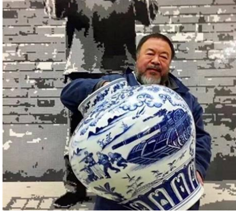
Tablo 1. Ai Weiwei savaş konulu mavi beyaz porselen vazo.

"Başlangıçta geleneksel olana karşıydım. Ancak bizi biz yapan geçmişimizdir. Kültür bir doğum izi gibidir. Eserlerimde o yüzden geçmişe referanslar vardır. Benim estetik anlayışım bu geçmişle oluştu. Ortak değerler bizi birbirimize bağlıyor. Ben bu değerleri yeniden yorumluyorum" Ai Weiwei (Sanal 2).