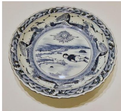
Tablo 3. Ai Weiwei Aylan Kurdi'nin yer aldığı porselen tabak.

Suriyeli çocuk Aylan Kurdi'nin cansız bedeni 6 Eylül 2015 yılında kıyıya vurmuş, cesedin fotoğrafı tüm dünyada büyük yankı yaratmıştı. Çinli muhalif sanatçı Weiwei, göçmenlerin yaşadıkları krize dikkat çekmek için Aylan Kurdi kıyıya vurmuş bedenini porselen bir tabak üzerinde kullanarak bir farkındalık yaratmayı amaçlamıştır.