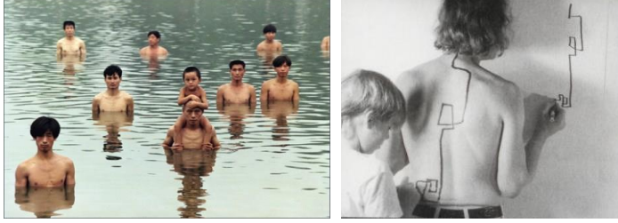
Resim 2. Zhank Huan, Bady/Language, 1970-1990

Performanslarını fotoğraflar aracılığıyla kayıt altına alan bir diğer sanatçı Zhank Huan ;kariyerine performans sanatçısı olarak başlamış, daha sonra, fotoğraf, video, enstalasyon sanatlarıyla da ilgilenmiştir. Sanatçı “The Bady Is Language”(beden dildir) ifadesi altında ürettiği işlerinde, beden üzerinden insan hakları kısıtlamalarına karşı sesini duyurmak istemiştir. Sanatçının “Göldeki Su Seviyesini Yükseltmek İçin” isimli çalışmasında gölün içinde duran insanlar görülmektedir. Bu eylem ve eylemi belgeleyen fotoğraflar; göçmen işçilerin maruz kaldıkları sömürüye ve zor yaşamlarına dikkat çekmek istemektedir.