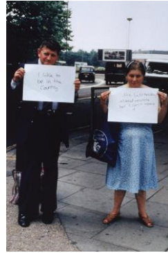
Resim 8. Gillian Wearing, “Başkalarının Söylemeni İstedığı Şeyleri Değil Senin İstedğini Söyleyen Tabelalar” Serisi , 1992-93.