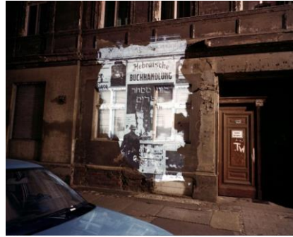
Resim 9. Shimon Attie “Duvardaki Yazı” 20x24, 1992.

Geçmişin parçalarını bugünün mekanlarına dahil ederek hafızaları canlı tutmak isteyen sanatçı; mekan, hafıza ve kimlik arasındaki ilişkiye odaklanmaktadır.