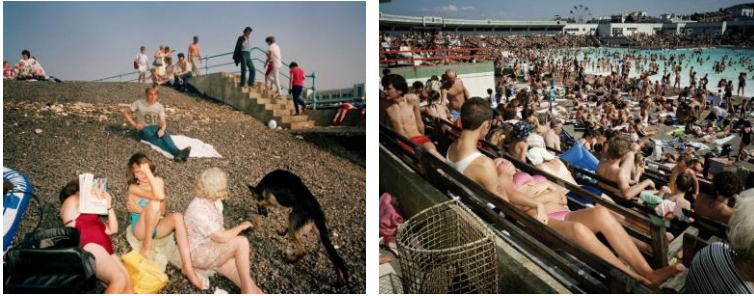
Resim 4. Martin Parr, “New Brighton, Son Tatil Yeri”, 1983-1985

Fotoğrafla yapmak istediğim, gerçekten taşan kurguyu ortaya çıkarabilmek. Böylece toplumun zaten içinde var olan doğal önyargılarını alabora edebiliyorum diyen Martin Parr ise çağdaş dünyayı kendisine konu olarak seçmiş ve onun sosyokültürel gelişimlerini ve değişimlerini ironik bir bakış açısıyla belgeleyen bir sanatçıdır.