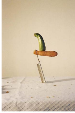
Resim 7. Peter Fischli David Weiss, Sessiz Bir Öğleden Sonra, 41x30 cm. 1984-1985

En güzel şeyin, bir şeyin yıkılmadan önceki dengesi olduğunu ifade eden Peter Fischli ve David Weiss'ın işleri ise, gündelik olanı yabancılaştırıp farklı bakış açısı ve anlam kazandırarak öne çıkmaktadır.