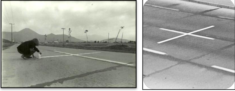
Resim 1. Lotty Rosenfeld, yolun üzerinde bir mil boyunca uzanan haçlar” performans fotoğrafları

Lotty Rosenfeld, 1979’dan bu yana kamusal alana müdahale eden performanslar ortaya koymakta ve işlerini fotoğraflar aracılığıyla belgelemektedir.