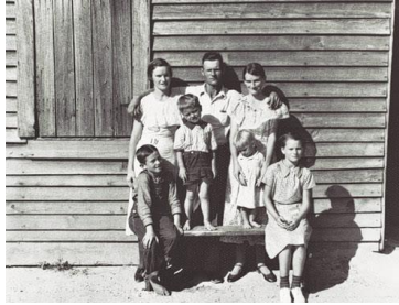
Resim 3. Sherrie Levine, “Walker Evans’tan Sonra”, 1981

Bu da şu sözü akıllara getirmektedir; Zaman çoğu fotoğrafı-en amatörce çekilmiş olanları bile-eninde sonunda sanat katına çıkaracaktır... (Sontag,2008:26)