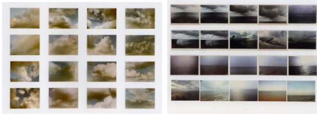
Resim 5. Gerhard Richter, 1976 51.7 cm x 73.5 cm Atlas Sheet: 327