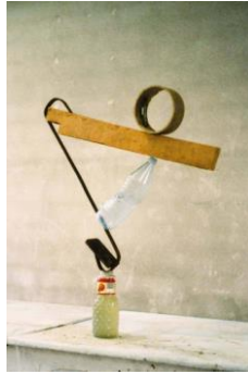
Resim 6. Peter Fischli David Weiss, Renkli fotoğraf, 40x30 cm. 1984-1986