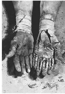
Resim 12. Dieter Appelt , fotoğraf, 16 x 11 in. (40.6 x 27.9 cm.)1979

Dieter Appelt ise çalışmalarında bellek, zaman ve aşkınlık gibi kavramları sorgulamaktadır.