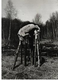
Resim 13. Dieter Appelt , “I dont want to elevate myself above the trees” 39 x 28 cm. (15.4 x 11 in.)

1945'te II.Dünya Savaşından sonra Berlin'e dönen ve etraftaki tarlalarda hayatını kaybeden askerlerin çürümekte olan bedenleriyle karşılaşmıştır. Bu görüntülerden çok etkilenen sanatçının “Peşini bırakmayan anılar” isimli serisi, bu etkilenmenin dışavurumu niteliğindedir. Bu seride daha çok “süreklilik” ve “çürüme” gibi temalar işlenmektedir.