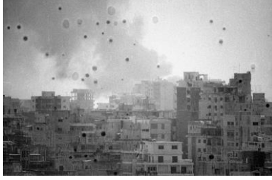
Resim 11. Walid Raadar, “Beyrut’82, Şehir Görüntüsü 5”, dijital baskı

Fotoğrafların gerçekliğine karşı sorgulayıcı bir yaklaşım benimseyenlerden biri de Atlas Group 'tur. Grup, fotoğraflara delil gözüyle bakma eğilimiyle oynayarak, sahte görüntüler üzerinden fotoğrafın inandırıcılığını zedelemek istemektedir.