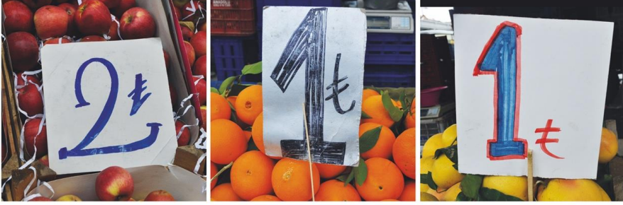
Görsel 3. Semt pazarından görüntüler.

örneklerde (Görsel 3) açıkça görüldüğü üzere TL simgesinin orijinalinden oldukça uzak çizildikleri görülmektedir.