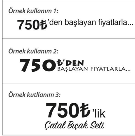
Görsel 10. TL Simgesinin rakamdan sonra yazımına ilişkin örnek kullanım