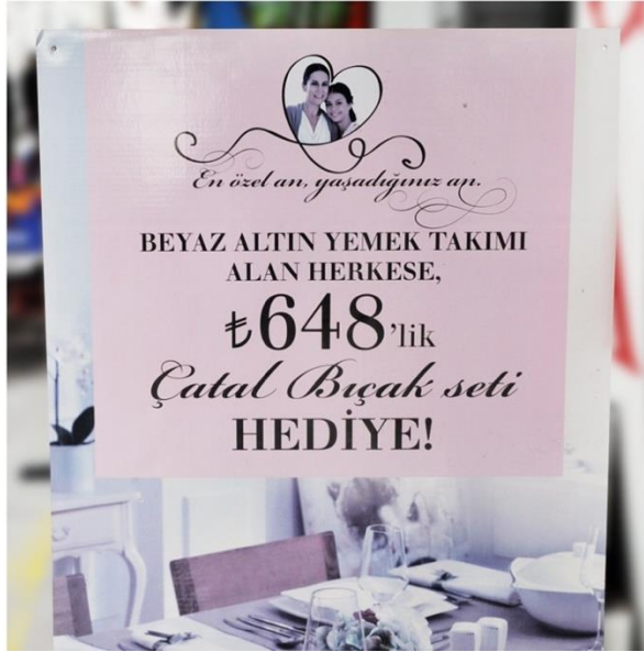
Görsel 6. Vitrin reklamından görüntü.

Benzer görüşü Tuncer de savunur ve simgenin rakamın önüne yazılması Türkçenin sentaksına uygun bir uygulama olmadığını söyler (2012: 31). Ayrıca Türk Dil Kurumunun kendi yayınladığı yazım kılavuzunda da kesme işaretlerinin kısaltmalardan sonra nasıl kullanılacağı açıklanmış ve getirilecek olan eklerin, okunan kelimenin son harfinin esas alınmasını gerektiği ifade edilmiştir. Örnek olarak da kg'dan, BDT'ye, TRT'den kelimeleri verilmiştir (TDK, 2009: 50). Böylece Türk Dil Kurumu kendi kurallarına ters bir uygulamaya izin vermektedir.