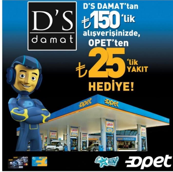
Görsel 9. D'S Damat- Opet alışveriş kampanya ilanı.

Aşağıdaki örnekte (Görsel 10) 'İstanbul Shopping Fest' ve 'D'S Damat-Opet' kampanya ilanlarındaki TL simgesinin doğru yazım biçimi gösterilmektedir. Bu örneklerdeki cümleler Türkçe'nin okunuşuna daha uygun bir söz dizimine sahiptirler. Ayrıca grafik tasarım açısından da doğru ve kullanışlı bir çözüm önerisi sunulmuştur.