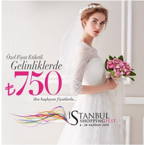
Görsel 8. İstanbul Shopping Fest afişi.

TL simgesinin farklı fontlara uyarlanması ve yeni font tasarımlarında yer alması uzun vadede de olsa çözülebilir. Ancak TL simgesinin rakamdan önce yazılma kararından vazgeçilmediği sürece grafik ürünlerde ortaya çıkan dil ve tasarım sorunu çözülemez. Merkez Bankasının TL simgesini uluslararası uygulamalara paralel bir karar olarak rakamın solunda yazılmasını istemesi anlaşılabilir. Fakat Türk Dil Kurumunun, Türk dil kurallarına aykırı olan, Merkez Bankasının kararını desteklemesi çok da anlaşılır bir durum değildir. Bu kararın sorunlu olduğu yapılan grafik tasarımlarda açıkça ortaya çıkmaktadır. Örnekler (Bkz. Görsel 8 ve 9) TL simgesinin rakamın önünde yazılmasının hem tasarım hem de Türkçe sentaksına göre yanlış olduğunu göstermektedir.