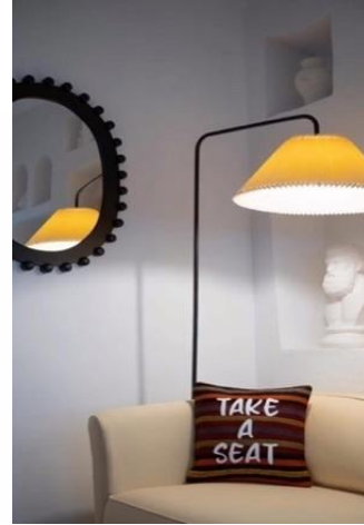
Görsel 15, 16. www.tapistr.com (URL 8)

Yastıkların üretiminde %100 pamuk ipliği kullanılarak dokumalar oluşturulmuştur. Doğal bitkilerle hazırlanan boyaların kullanılmasıyla çalışılan el dokuması yastıkların ön yüzlerine baskılar yapılmakta ve bu baskıların başlıkları kişilerin isteğine göre biçimlendirilmektedir (URL 8). Tarihsel mirasın izlerini taşıyan bu sanat günümüzde kendini değişik objelerde göstermeye devam etmektedir. Üretilen yastıklar dokumalarda gelenekselliğin izlerini taşıırken üzerine yapılan baskılarla modernliğe gönderme yapmaktadır. Ayrıca yapılan farklı baskılar tasarımların tamamen kişiye özel olmasını sağlamaktadır. Tarihten bugüne hoş bir geçiş yapan bu yastıklar eskilere dair esinti oluşturan bir atmosfer yaratırken aynı zamanda yenilikçi bir görünüm de yansıtmaktadır.