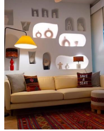
Görsel 12. 35x30cm www.tapistr.com (URL 7)