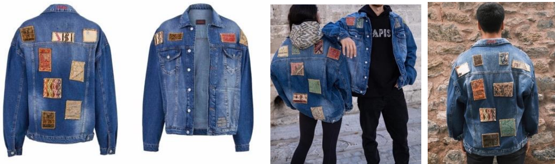
Görsel 8, 9, 10, 11. www.tapistr.com (URL 6)

Günümüze uygun kilim dokumalarla özgün şekilde tasarlanmış sweatshirtler, klasik ve çağdaş yaklaşımları bütünleştirerek güncelliğe uyum sağlamış ve tarihin bu güzel sanatı moda sektörüne çeşitlilik katmıştır. Geçmişin izlerini taşıyan bu kıyafetler kültürel değerleri yansıtan özelliğiyle dikkat çekerek zengin bir görünüm sergilemektedir. Geleneksel unsurları bulundurarak sıradanlıktan uzaklaşan bu sweatshirtler, geçmişin değerleriyle çağın trendlerini bir araya getirmeyi başarmış tasarımları temsil etmektedir. Modern dokunuş sergileyen bu tasarımlar fark yaratan fikir olarak öne çıkmaktadır.