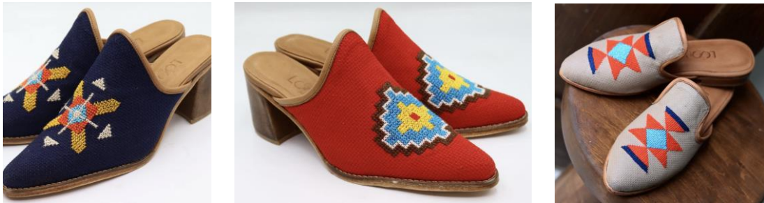
Görsel 36, 37, 38. www.thelooparts.com (URL 10)

Özgün tarzda hoş imaj sergileyen bir ayakkabı modeli olan makosenler kilim dokumalarıyla üretilmiştir. Şık ve modern bir görünüm elde etmek isteyen kadınlar için yaz aylarında rahatlığıyla tercih edilen bu ayakkabılar, üzerindeki renkli dokumalar ile oldukça dikkat çekmektedir. Bu ayakkabıların rahat bir giyim deneyimi sunmasının en önemli sebebi ayağı terletmemesi ve kaymamasından kaynaklanmaktadır. Makosenlerin üzerinde kullanılan kilimlerin değeri, kalitesi ve güzelliği modaya uyum sağlamaktadır.