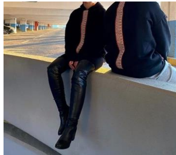
Görsel 1, 2. www.tapistr.com (URL3).