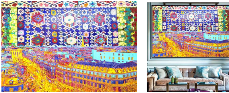
Görsel 52, 53. Karl Talip Kara, "Paris with Karaman Kilim Sky", Pamuk tuval üzerine yağlı boya, 4x199x239 cm (URL 12)

Dekoratif amaçlı çalışılan tablolar görsel açıdan oldukça etkileyici ve estetik bir görünüm sergilemektedir. Yağlı boya ile çalışılan sanat eserleri sanatçının üslubuyla yorumlanarak farklı bir deneyim sunmaktadır. Kilim motiflerinin günümüzde değişik tasarımlarla görsel sanatlar alanında kullanılması disiplinler arası yaklaşımın özgün bir birleşimini ifade etmektedir. Çağdaş bir anlayışa dayalı olarak oluşturulan kilim motifli tablolar, çeşitli mekanlarda göz alıcı dekorasyon unsuru olarak ortamı renklendirmektedir. Tablolarda yer alan motifler sanatçı tarafından adeta ilmek ilmek iplikle dokunmuş gibi çok ince fırça darbeleriyle çalışılmış özgün kompozisyonlardan oluşturulmuştur. Çalışmalardaki motifler izleyicide farklı duygu durumları oluşturmaktadır. Eserlerde kullanılan geniş renk skalası ve formlar dikkat çekmekte, resimde iletilen sembolik anlamlar tabloya görüntüsel derinlik kazandırmaktadır. Sanatçı yapıtlarında mükemmel yeteneği ve yaratıcılığını kendi üslubuyla yorumlayarak izleyicide hayranlık uyandırmaktadır.