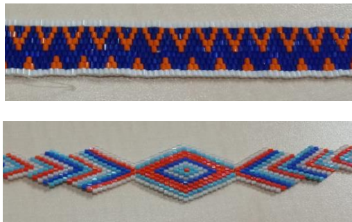
Görsel 63, 64. Seçil Torun

Stilize edilen kilim motiflerinin biçimlendirilerek ve soyutlama yapılarak yağlı boya tablolarında kullanılması orjinal bir tasarım yaklaşımı olarak nitelendirilebilir. Kilim motiflerinin soyutlama tekniğiyle tablo şeklinde çalışılması geleneksel ve modernliğin sentezini ifade etmektedir. Özgün motiflerle bütünleşerek oluşan soyut kompozisyonlar izleyicide tarihi atmosferin hislerini uyandırmaktadır. Desen, şekil ve renklerin bir araya getirilmesiyle oluşturulan ve estetik olarak tasarlanan motifler, eserlerde kendine özgü bir duruş sergilemektedir. Tablolarda ustalıkla oluşturulmuş bu motifler çalışmalara hareket kazandırarak tarihte yolculuk hissi uyandırmakta ve geçmişin öyküsü yapıtlarda hissedilmektedir. Geleneksel motiflerin günümüzde sanat eseri olarak tablolarda yerini alması, tarihi dokunuşların çağımız sanat anlayışı ile yeniden hayat bulduğunun göstergesidir.