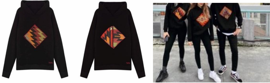
Görsel 5, 6, 7. www.tapistr.com (URL 5)

Sweatshirtlerin üzerine dikdörtgen şekilde yerleştirilen kilimler 1966 yılında Balıkesir ilinde üretilen dokumalardan meydana gelmektedir. Her sweatshirtün üzerindeki kilimler, her parça için ayrı desenlerde dokunmuştur. Ayrıca kullanılan her desen yalnızca tek ürün üzerinde kullanılmaktadır (URL 4). Tarzıyla göze çarpan bu sweatshirtler geleneksel sanatın modayla iç içe olmasıyla birlikte farklı bir kombinasyon oluşturmaktadır. Bu sweatshirtler spor giyim stiliyle günlük kullanımda gençlere farklı bir seçenek sunmaktadır.