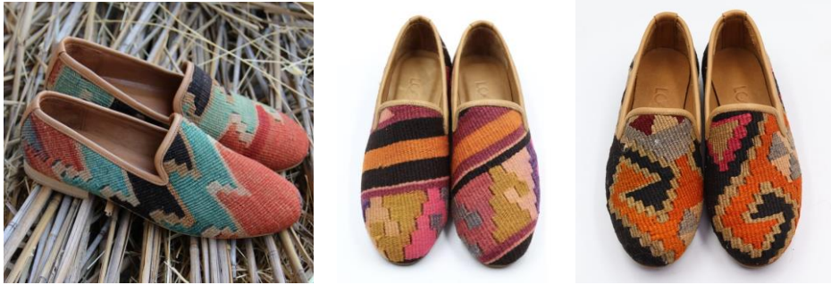
Görsel 34, 35. www.thelooparts.com (URL 10)

Gelenekselle modernliğin buluştuğu kilim dokumalarla yapılan zarif terlikler oldukça dikkat çekici özel ürünlerdir. Bu terliklerde uygulanan motifler, geleneksel dilin tarihi evrimiyle yenilikçi bir biçimde tekrar yorumlanışının ifade edilidir. Özgün görselliğiyle iz bırakan ürünler arasında yer alan terlikler çağa uygun bir görünüm içerisindedir. Bu ürünler sıradan terliklerden farklılık arz ederek geleneksel motiflerle birleşmiş ve gündelik yaşama entegre olarak modayla uyumlu hale gelmeyi başarmıştır.