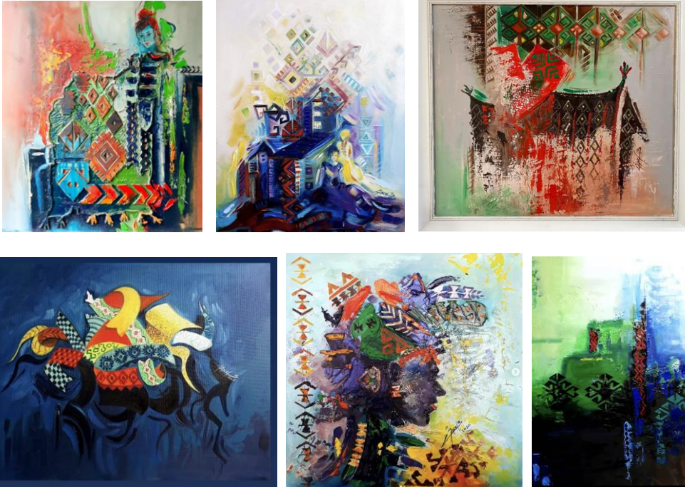
Görsel 54, 55, 56, 57, 58,59. Burcu Öncel (URL 13)