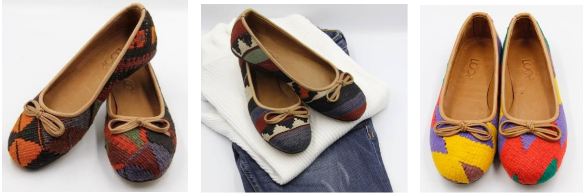
Görsel 25, 26. www.thelooparts.com (URL 10)

Kullanışlı iç hacim ve kilim desenleriyle tasarlanmış oversize çantalar günlük eşyaları rahatlıkla taşıyabilme özelliği ve işlevselliğiyle dikkat çeken ürünlerdir. Çantalarda gelenek vurgusu kolaylıkla fark edilmekte ve elegan görünümüyle tercih edilir seçenekler arasında yer almaktadır. Deri ve dokuma malzemesinin birliktelik uyumu hoş bir bütünlük sergilemektedir. Kökleri çok eskiye dayanan sanatın yeni baştan yorumu bilinçli kullanıcılar için paha biçilmezdir.