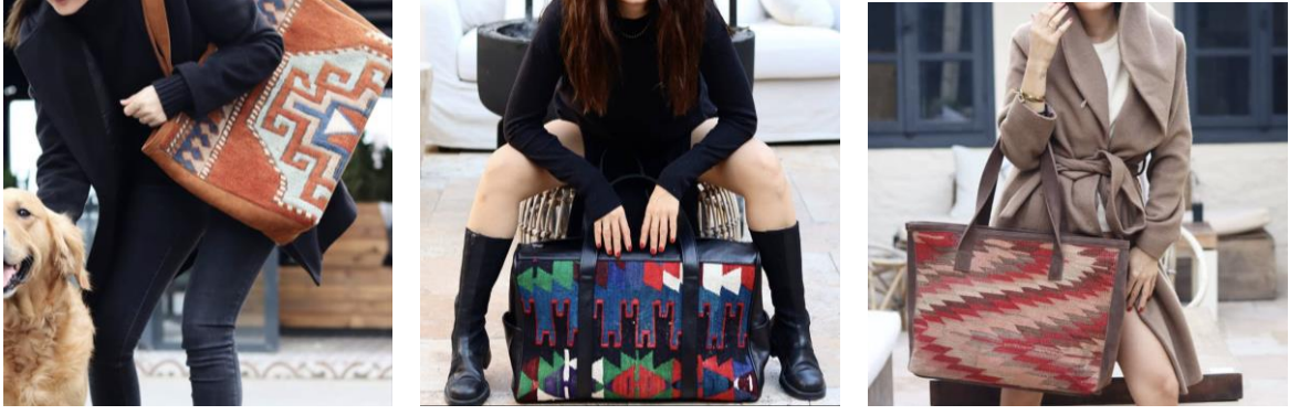
Görsel 22, 23, 24. www.thelooparts.com (URL 10)

Kullanışlı iç hacim ve kilim desenleriyle tasarlanmış oversize çantalar günlük eşyaları rahatlıkla taşıyabilme özelliği ve işlevselliğiyle dikkat çeken ürünlerdir. Çantalarda gelenek vurgusu kolaylıkla fark edilmekte ve elegan görünümüyle tercih edilir seçenekler arasında yer almaktadır. Deri ve dokuma malzemesinin birliktelik uyumu hoş bir bütünlük sergilemektedir. Kökleri çok eskiye dayanan sanatın yeni baştan yorumu bilinçli kullanıcılar için paha biçilmezdir.