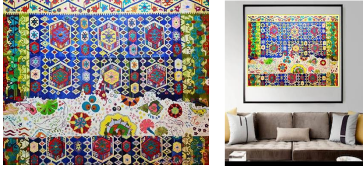
Görsel 47,48. Karl Talip Kara, "İstanbul-Anatolia", Pamuk tuval üzerine yağlı boya, 4x110x140cm (URL 12)