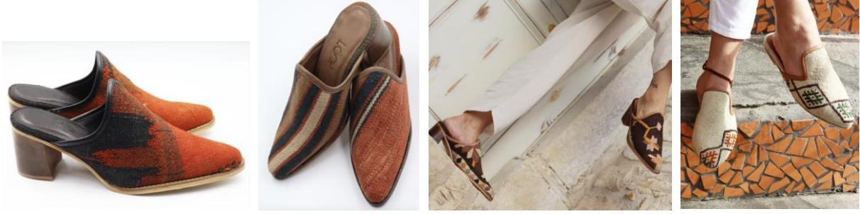
Görsel 30, 31, 32, 33. www.thelooparts.com (URL 10)

Gelenekselle modernliğin buluştuğu kilim dokumalarla yapılan zarif terlikler oldukça dikkat çekici özel ürünlerdir. Bu terliklerde uygulanan motifler, geleneksel dilin tarihi evrimiyle yenilikçi bir biçimde tekrar yorumlanışının ifade edilidir. Özgün görselliğiyle iz bırakan ürünler arasında yer alan terlikler çağa uygun bir görünüm içerisindedir. Bu ürünler sıradan terliklerden farklılık arz ederek geleneksel motiflerle birleşmiş ve gündelik yaşama entegre olarak modayla uyumlu hale gelmeyi başarmıştır.