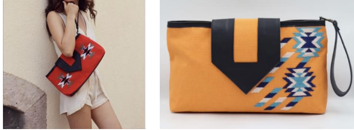
Görsel 18, 19. www.thelooparts.com (URL 10)

Gövdeleri ve ayakları ahşap mango ağacından yapılan ve ev dekorasyonunda kullanılan puflar el dokuması kilim ile üretilmiştir (URL 9). Tasarımında kullanılan kilim motiflerinin art arda tekrarlarından meydana gelen şemayla oluşması pufun yüzeyine ritmik bir görünüm kazandırmıştır. Pufların ayakları ve gövdesinde kullanılan mango ağacı ile el dokuması kilimler geniş renk skalasıyla birleşerek elegan bir görünüme sahip olmuştur. Geleneksel sanatın değişime açık tasarımlarla gündelik eşyalarda hayat bulması sürdürülebilirlik açısından oldukça önemlidir.