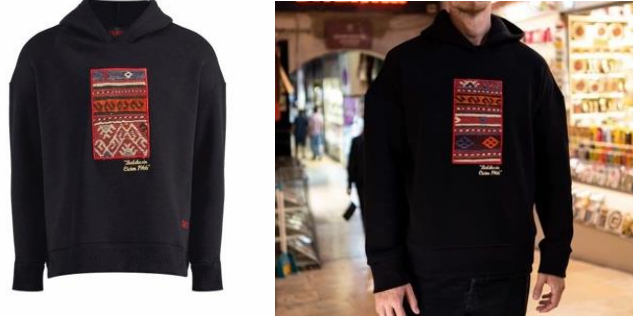
Görsel 3, 4.

Gençlere tarihin sanatlarını hatırlatır nitelikteki bu sweatshirtler el dokuması kullanılarak tasarlanmıştır. Siyah kumaş üzerine dikey şerit formunda yerleştirilen dokuma parçaları kullanılan kırmızı-beyaz renkler ve yıldızlı süslemeleriyle Anadolu topraklarını simgelemektedir. Üzerinde bulunan motifler 'bereket' ve 'göz' sembollerini içermektedir (URL 3). Sweatshirtler; günümüzde şıklık ve rahatlığıyla tercih edilen, gençler tarafından popülaritesi yüksek olan giyim eşyalarıdır. Kilim dokumalar kullanılarak özgün bir şekilde tasarlanan bu sweatshirtler, farklı bir tarz oluşturarak yeni bir yorum sergilemektedir.