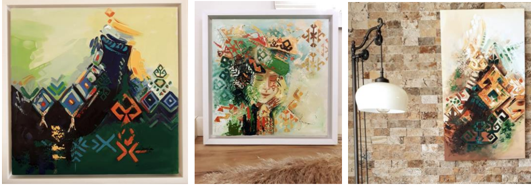
Görsel 60, 61, 62. Burcu Öncel (URL 13)

Stilize edilen kilim motiflerinin biçimlendirilerek ve soyutlama yapılarak yağlı boya tablolarında kullanılması orjinal bir tasarım yaklaşımı olarak nitelendirilebilir. Kilim motiflerinin soyutlama tekniğiyle tablo şeklinde çalışılması geleneksel ve modernliğin sentezini ifade etmektedir. Özgün motiflerle bütünleşerek oluşan soyut kompozisyonlar izleyicide tarihi atmosferin hislerini uyandırmaktadır. Desen, şekil ve renklerin bir araya getirilmesiyle oluşturulan ve estetik olarak tasarlanan motifler, eserlerde kendine özgü bir duruş sergilemektedir. Tablolarda ustalıkla oluşturulmuş bu motifler çalışmalara hareket kazandırarak tarihte yolculuk hissi uyandırmakta ve geçmişin öyküsü yapıtlarda hissedilmektedir. Geleneksel motiflerin günümüzde sanat eseri olarak tablolarda yerini alması, tarihi dokunuşların çağımız sanat anlayışı ile yeniden hayat bulduğunun göstergesidir.