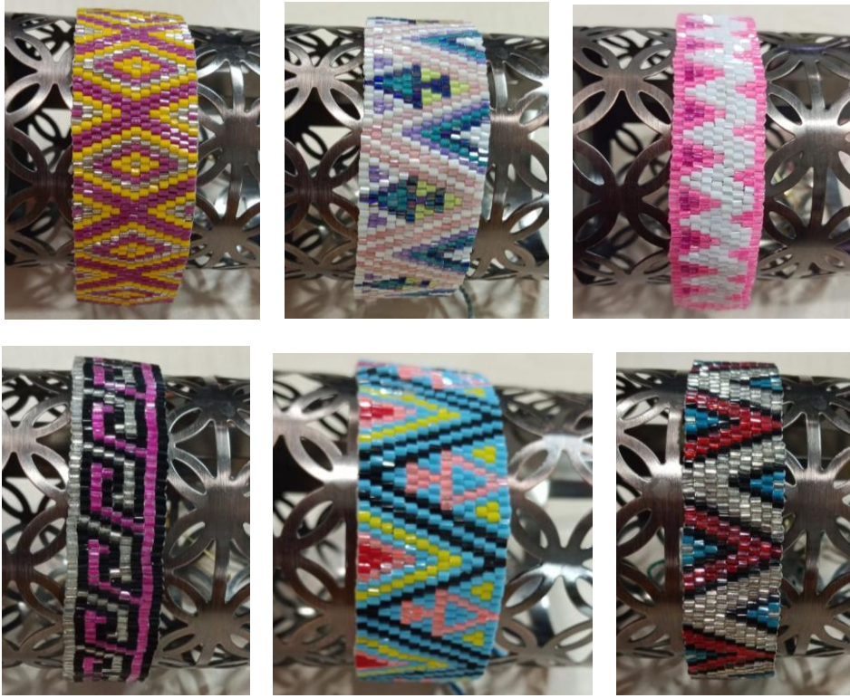
Görsel 65, 66, 67, 68, 69. Seçil Torun

Miyuki boncukların tam ve yarım olarak işlenmesiyle oluşturulan kilim motifli bileklikler motifleriyle gelenekselliğe gönderme yapmakta aynı zamanda yenilikçi tasarım yaklaşımını ortaya koymaktadır. Bu motiflerin işleniş şekli tasarımlara hareket katarak estetik bir görünüm sergilemektedir. Bilekliklerde kullanılan boncuklar renk açısından çeşitli seçenekler sunarak kilim motiflerinin ahenkli bir duruş sergilemesini sağlamaktadır. Çalışmalar motiflerin dizayn ediliş şekliyle incelikli görünümde bir takı modeli sunmakta ve kıyafet kombinasyonuna canlılık katarak tamamlayıcı bir özellik taşımaktadır. Geçmişin yansımalarını taşıyan motifler yeni takı tasarımlarıyla kendini göstererek sürekliliğini korumaktadır.