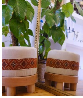
Görsel 17. www.tapistr.com (URL 9)

Gövdeleri ve ayakları ahşap mango ağacından yapılan ve ev dekorasyonunda kullanılan puflar el dokuması kilim ile üretilmiştir (URL 9). Tasarımında kullanılan kilim motiflerinin art arda tekrarlarından meydana gelen şemayla oluşması pufun yüzeyine ritmik bir görünüm kazandırmıştır. Pufların ayakları ve gövdesinde kullanılan mango ağacı ile el dokuması kilimler geniş renk skalasıyla birleşerek elegan bir görünüme sahip olmuştur. Geleneksel sanatın değişime açık tasarımlarla gündelik eşyalarda hayat bulması sürdürülebilirlik açısından oldukça önemlidir.