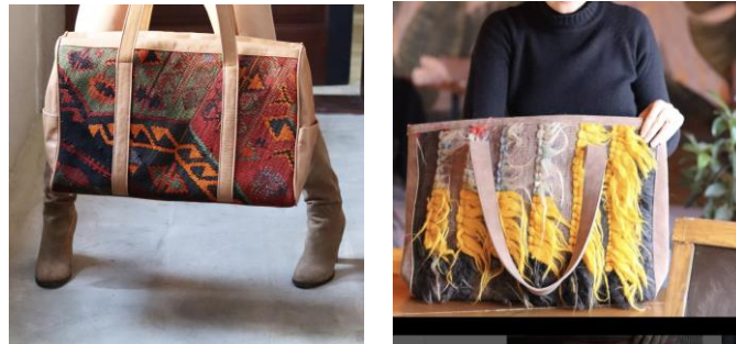
Görsel 20, 21.

Kilim desenleri daha önceki dönemlerin sanatından esinlenerek güncel çantalarla bir araya getirilmekte bu da çantalara geleneksel bir kimlik kazandırmaktadır. İşlenerek oluşturulan etamindeki motifler çantaya ayrı bir incelik katmakta, geniş renk yelpazesindeki canlılık çantalardaki uyumuyla ilk bakışta göze çarpmaktadır. Alışılmışın dışında farklı bir objeye bürünen etamin işlemeler, tarihi ve şimdiki zamanı bütünleştirmiş ve taşımış olduğu otantik değerini yeni görseleliğiyle alternatif bir tarz oluşturmuştur. Özel ve günlük kullanımda tercih edilen çantalar, hitap ettiği kişilerde tamamlayıcı bir aksesuar olarak kullanılabilir.