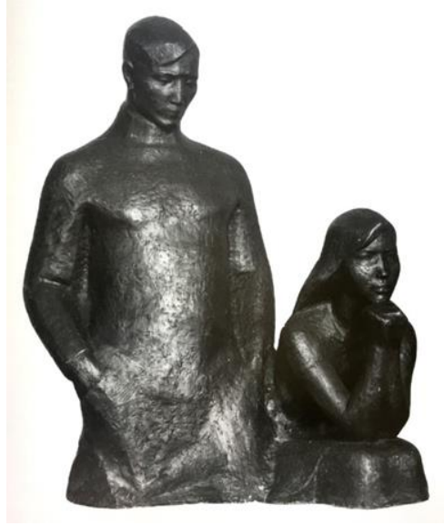
Görsel-8. "Çağdaşlar", 1970, Alüminyum, 110x72x59 cm.

"20'li yıllar" adlı kompozisyonda (1970, A. Muhutdinov ile birlikte) (Görsel-9) savaş konusunu ele almıştır. Kompozisyonu oluşturan elemanlar detaylardan arındırılarak yorumlanırken, üçlü figür grubunda izleyiciye sezdirilen duygusal yoğunluk, durağan halde betimlenen figürlerde hareket hissi uyandırıp temanın özünü net bir şekilde gözler önüne sermektedir.