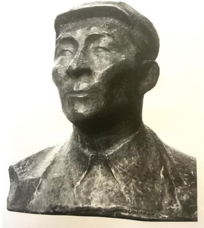
Görsel-5. "Fabrikadaki Kalıpcı", 1975, Metal.