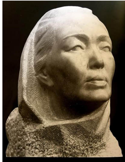
Görsel-3. "Baken Kadiykeeva", 1974, Mermer. 55x26x30 cm.

Kaynak: Viktor Arnoldoviç Şestopal, G. Aytieva Katalog.