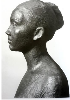
Görsel-6. "Çolpon", 1978, Metal.

Pritkova'ya (1982) göre, uzun yıllar boyunca Şestopal'ın çalışma alanı olarak ilgisini, gençlik teması çekmiştir. Sanatçının üzerinde yoğunlaştığı diğer bir konu ise birey olarak insan ve onun ruhsal durumudur. "Onuncu sınıf öğrencisi", "Şefkat", "Çolpon" (Görsel-6), "Dalgalarda" (Görsel-7), "Çağdaşlar" (Görsel-8) (A. Muhutdinov ile birlikte) adını verdiği çalışmalarında konuya yaklaşımı görülmektedir.