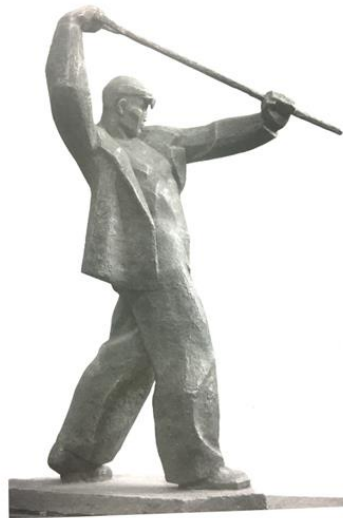
Görsel-11. "Dökümcü", 1972, Metal. Kaynak: Ploskuh, B.M., Muksunov, P.M.(2014).

Aslında, çalışmalarında, dağlardaki zorlu yaşamın oluşturduğu Kırgız coğrafyasının güzel ama sert doğasına karşılık gelen, güçlü karakterini aktarmaya çalışmıştır. Sanatçı dağlık Kırgız coğrafyasını konu merkezine koyarak, coğrafyanın kendine has görkemli yapısı ve bu topraklarda yaşayan insanların sıcak ve lirik tavrına uygun betimlemeler gerçekleştirmiştir. Emegin ve ülke ekonomisinde maddi zenginlik yaratan insanların önemini vurgulayan temaların 1980'li yıllarda V. Shestopal'ın çalışmalarında önemli bir konumda değerlendirildiği görülmektedir. "Dökümcü" (1972, Alüminyum) isimli eseri (Görsel-11), ülkenin sanayi kalkınmasındaki emeği kişileştiren dinamik ve net bir örnek olarak dikkat çekmektedir. (Voropaeva, 2017).