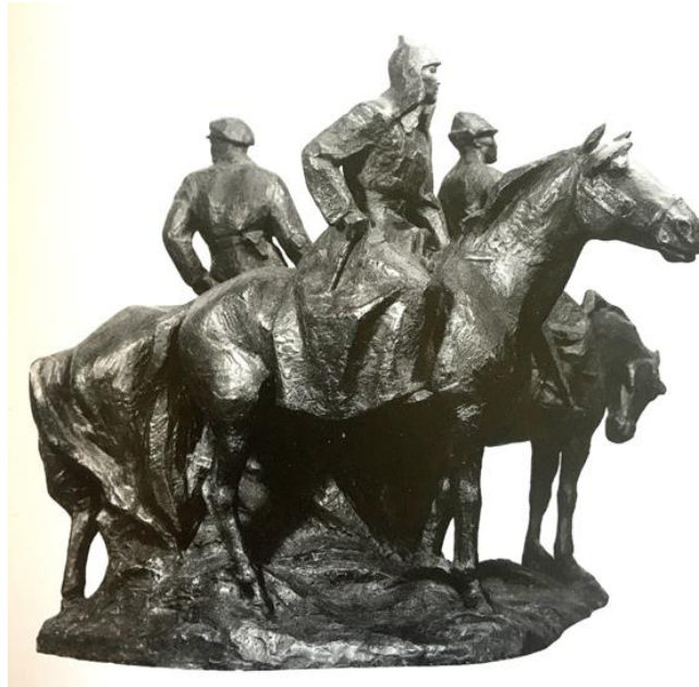
Görsel-9. "20'li Yıllar", 1970, Metal.

"20'li yıllar" adlı kompozisyonda (1970, A. Muhutdinov ile birlikte) (Görsel-9) savaş konusunu ele almıştır. Kompozisyonu oluşturan elemanlar detaylardan arındırılarak yorumlanırken, üçlü figür grubunda izleyiciye sezdirilen duygusal yoğunluk, durağan halde betimlenen figürlerde hareket hissi uyandırıp temanın özünü net bir şekilde gözler önüne sermektedir.