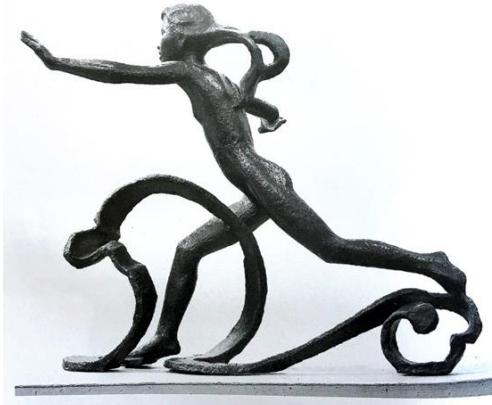
Görsel-7. "Dalgalarda", 1975, Metal.

Kaynak: Ploskuh, B.M., Muksunov, P.M.(2014).