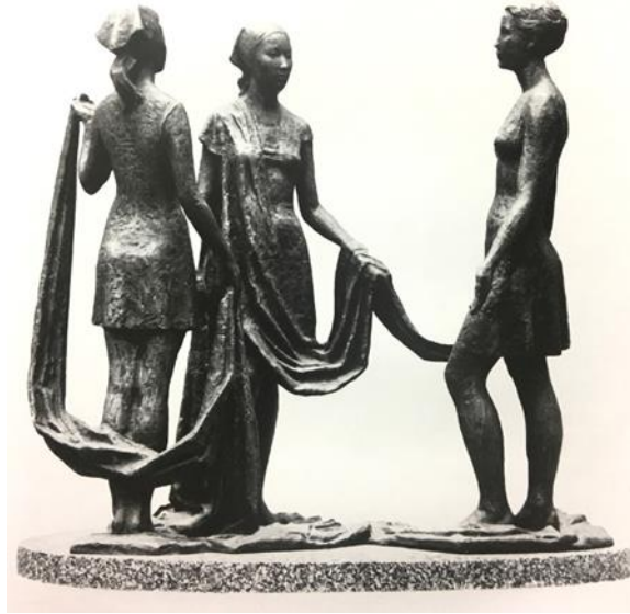
Görsel-12. "Dokumacılar", 1982, Bronz.

Sanatçı, "Dokumacılar" (1982, Bronz) isimli eserinde, endüstri gelişimi vurgusuyla ele aldığı Kırgızistan temasında yeni ve yaratıcı bir başarıya imza atmıştır. Figürden figüre akan ve ritmik biçimde üçlü figürü çevreleyen kumaş sarmalıyla betimlenen eserde, uzamsal bileşimin yakınlığı, genç dokumacıların ellerinden akan kumaş parçasının muazzam uzunluğu boyunca elde edilmiştir. Kompozisyonun her detayı, gerçekçi biçimde ve dikkatlice işlenmiştir. Bu zarif kompozisyon (Görsel-12), usta gençliğin zarafet ve güzelliğini, aynı zamanda da üretimin coşkusu bir şenlik atmosferinde vurgulamaktadır. (Voropaeva, 2017).