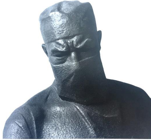
Görsel-2. "Cerrah", 1966, Alçı, Şamot. 65X95X45cm.

Küçük ve büyük ölçekli çalışmalar ile anıtsal heykel türündeki eserleriyle, Kırgız sanat çevreleri başta olmak üzere Kazakistan ve Rusya Federasyonu'nda da tanınan bir sanatçıdır. Tematik kompozisyonların yanı sıra, çağdaşlarının portrelerinden oluşan büst çalışmaları ve anıtsal heykelleriyle bilinmektedir. Sanatsal başarısını, insan vücudu üzerine yaptığı derin incelemelere, insan karakteri ve iç dünyasına yönelik gözlemlerine, ayrıca heykellerinde kullandığı farklı malzemelere (taş, ahşap, metal, seramik) duyduğu ilgiye borçludur. Başarılı Kırgız şahsiyetlerinin heykellerini içeren bir galeride sergilenen işleriyle sanat çevreleri tarafından övgü almıştır. Galeride "Cerrah" (1966) büstü (Görsel-2), Akademisyen "İ.Ahunbaev" (1966) büstü, oyuncu "Baken Kadiykeeva" (1974) büstü (Görsel-3), "Heykeltıraş Manuilov" (1974) büstü (Görsel-4), "Fabrikadaki Kalıpcı" büstü (Görsel-5), M. V. Frunze Djoldoş Musabekob (1974-1975) büstü ve "Pryadilshitsa Nurmanbetov" (1977) büstü yer almaktadır.