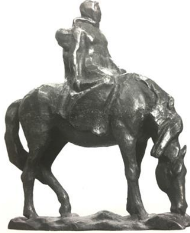
Görsel-10. "Issık Göl Üstünde", 1979, Bronz. Kaynak: Ploskuh, B.M., Muksunov, P.M.(2014).

arkaya dönüşüyle hissettirdiği rahat tavrı ve önde yer alan iki figürün uzaklara odaklanan bakışlarıyla bedenlerinde yer alan gerilim duygusu, esere anıtsal bir görünüm kazandırmaktadır. Eleştirmenlere göre, mekansal kompozisyon alanındaki modern arayışlara yabancı olmamasına rağmen, V.Şestopal'ın sanatta popüler yaklaşımlardan çok az etkilendiği görülmektedir. Yeni materyallere ve tekniklere, seçici bir ilgi gösteren sanatçı, her zaman yaratıcı kişiliği ile uyumlu olan ustalığıyla birleştirmektedir. Bu nedenle, eserleri doğrudan görülebilen, hayati materyallerin orijinallliği açısından dikkate değerdir. Eserlerinin genel görünüşü, büyük heykel ustalarının klasik imajlarını hatırlatırken, ölçülü, sakin ve anıtsal bir izlenimdedir (Voropaeva, 2017). Duygunun ön planda olduğu figür heykellerinde olduğu gibi büstlerde de V.Şestopal gerçekçi tasviri bir kural olarak seçmiş ve uygulamıştır. Sanatçının yarattığı görüntülerin çoğu, heykeltıraş tarafından derinden hissedilen olağanüstü kahramanlık duygularıyla bütünleştiği kadar, 1979 yılında gerçekleştirdiği "Issık Göl Üstünde" isimli heykelinde olduğu gibi günlük hayatın izlenimlerini de taşımaktadır (Görsel-10).