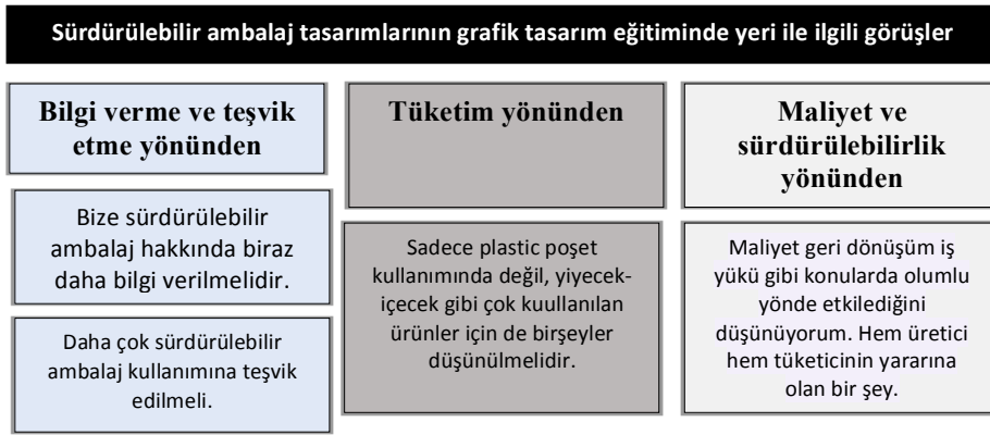
Őekil 7. Srdrlebilir ambalaj tasarımlarının grafik tasarım eęitiminde yeri ile ilgili grřler

ęrencilerin bu soruya ynelik grřleri; yapılan analiz sonucunda Őekil 6'da grldę zere "bilgi verme ve teřvik etme ynnden", "tketim ynnden" ve "maliyet ve srdrlebilirlik ynnden" olmak zere c tema altında toplanmıřtır.