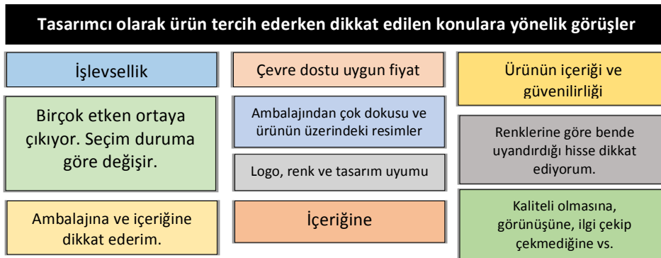
Őekil 8. Tasarımcısı olarak rn tercih ederken dikkat edilen konulara ynelik grřler

ęrencilerin bu soruya ynelik grřleri; yapılan analiz sonucunda Őekil 8'de grldę zere 11 tema altında toplanmıřtır.