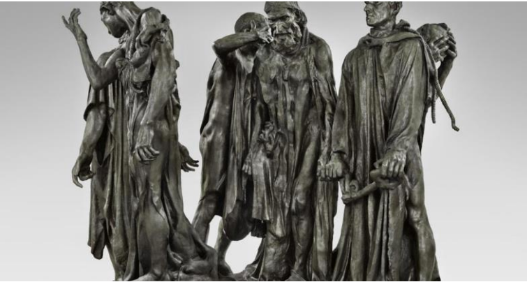
Resim 5. Auguste Rodin, Calais Burjuvaları

Rodin düşünen adam adlı heykelinde bu umutsuzluğun insanı nasıl bir ruh dünyasına sürüklediğini çok iyi yansıtır. Dünyaya atılmışlığın verdiği acı tüm iliklerine kadar işlenmiş durumdadır. Belki yaşam kendisine hiçbir şey sunmamıştır. Her şey sanal bir dünyada gerçekleşmektedir. Bu sanal dünyada kendini var etme çabası başarısızlıkla sonuçlanır. Bu başarısızlık, tekrar eden gelgitler içinde sürekli çatışmalardan kaynaklanır. Bu çatışmalar ise tüm enerjisini almıştır. Bir tükenmişlik yaşanmaktadır.