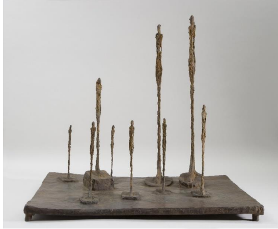
Resim 1. Alberto Giacometti, Orman ,

“Yaşamın yalnızca kesintisiz bir “bir zamanlar var olma” olduğunun bilgisine, yani yaşamın kendi kendini yadsıma, kendi kendini yiyip tüketmeyle, kendi kendisiyle çelişmeyle yaşayan bir şey olduğunun bilgisine damgasını vurur (Nietzsche, 1994: 63).