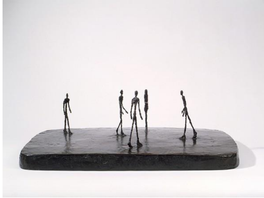
Resim 2. Alberto Giacometti, Piazza.

“Yeryüzüne bırakılmış insanın var oluşu özü gereği sonludur, ölümle sınırlıdır. “Yüzü ölüme dönük var oluş”tur. Günün birinde, “ilerisi” diye bir şey kalmaz;” (Wahl, 1999: 19). Yüzünü ölüme dönmesinin yanında bir içe dönüş de söz konusudur. Dünya aslında büyük çatışmaların yaşandığı acı dolu bir sahnedir. Bu çatışmaları Giacometti’nin heykellerinde görmekteyiz.