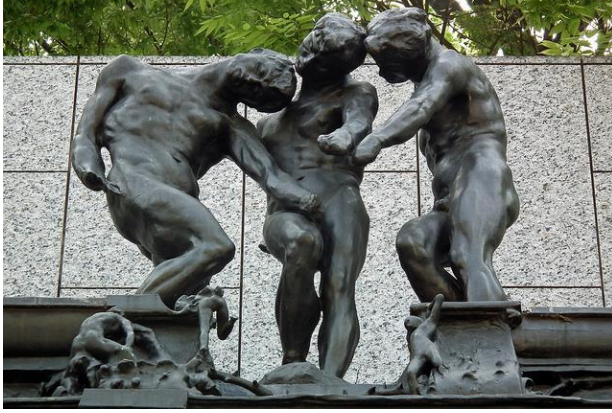
Resim 5. Auguste Rodin, Cehennemin Kapısında Üç Gölge

Rodin'in Cehennemin Kapısında Üç Gölge adlı yapıtını da Varoluşçu akımın içine almamız mümkündür. Yalnızlık, insanın bir yazgısıdır. Özellikle dünyaya atılmış insan hep kendisi iledir. Hayat ve ölüm arasında bir yeredir, bunaltı, sıkıntı içinde döner durur, çözüm bulamaz, karanlık dehlizlerde boşu boşuna çıkış yolu arar. Çaresizlik, ne yapacağını bilemeyen bu insanların kendi kaderine boyun eğdiğini görürüz. Yaşamın yükü altında ezilmiş, bir nevi pes etmiş gibidir. Her şeyi bitmiş, geçmişle olan bağları kopmuş, bir gelecek tasavvuru ortadan kalkmıştır, kendi yazgısının kendisini yavaş yavaş eritmesini izlemektedir. Aynı tema, karamsarlık, bir çıkış yolu bulamama, Rodin'in diğer eserlerine benzeyen bu yapıtta da yine varoluşçu temayla karşılaşırız. Diğer eserlerinden farklı olarak Cennetin Kapısında Üç Gölgede de bu ruh halinin daha da şiddetli vurgulandığına tanık oluyoruz. Bu bunalım hali o kadar yoğun ki kendi varlığının artık silinmeye yüz tuttuğu, kendi bilincinin kaybolduğu, bedenlen tamamen yıkıldığının bir tasviridir. Her şey onlar için bitmiştir, yaşam artık onlara derinden gelen bir ıstırap vermektedir, bize acı iliklerine kadar işlemiş bir ruh halini yansıtır.