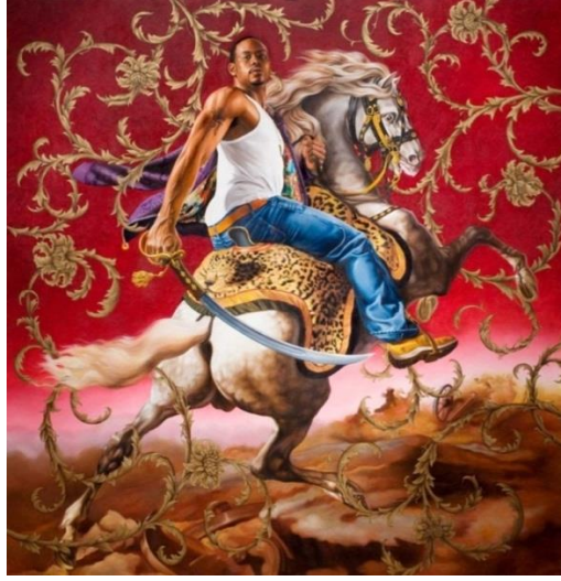
Tablo 5. Rumors of war officer of the hussars, 2007, oil and on canvas 108" x 108

siyah gençlerle yeniden yaratmış ve Bizans'a ait dini tabloların yerini hip-hop kültüründen esinlenen dövmeli gençler almıştır.