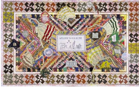
Tablo 1. Miriam Schapiro “Harikalar Diyarı” (1983), Akrilik ve Kumaş Kolajı Tuval Üzerine , 90x144cm”.

Miriam Schapiro ve birçok kadın sanatçının buluntu kumaş parçaları ve akrilik boyayla gerçekleştirdikleri kolaj-resimler dönemin feminist terminolojisi içinde famaj (femmage) olarak adlandırılmaktadır. Kadınlar famaj tekniğini kendileriyle özdeşleştirdikleri için çalışmalarında çok etkin olarak kullanmışlardır. Bu durum kadın sanatçılar açısından kadın hareketinin ve toplumsal cinsiyet mücadelesinin görsel simgeleri olarak kabul görülmüştür.