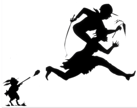
Tablo 3. Kara Walker “Kamp Köyü Kadınları” 1998, Duvar Üzerine Kesilmiş Kağıt Yapıştırma.

Kara Walker ırkçılık sorunlarını antiestetik bir dil kullanarak Amerika’da yaşanan adaletsizlikler açısından anlatır. Siyah rengin gölgesiyle de kültürel olarak temsili hiyerarşik yaşama vurgu yapar.