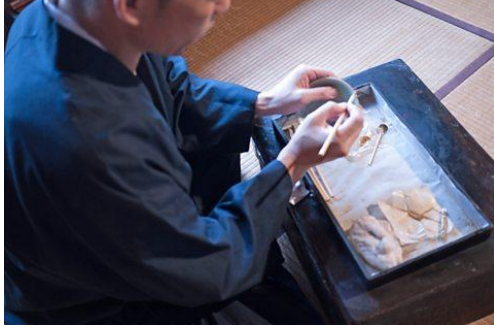
Resim 4: Kintsugi ustasının kırılan porseleni tamir etme işlemi.

Kintsugi tekniđinde kullanılan başka üsluplarda bulunmaktadır. Bunlardan biri olan makienaoshi de tamir alanlarına ek olarak altın, tamiri yapılan seramik objenin üzerindeki dekoru yansıtmada kullanılmaktadır. Böylece dekorun devamı sağlanmaktadır.