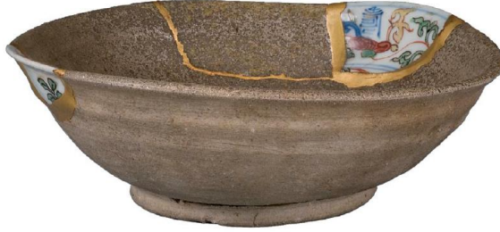
Resim 6: 15.yüzyılYobitsugi tekniği ile restore edilmiş çanak, Tokoname Dönemi