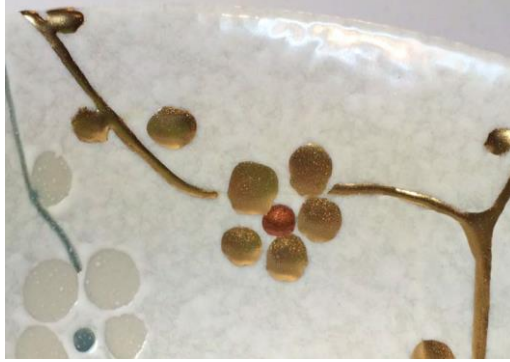
Resim 5: Makienaoshi tekniđinden bir detay

Kintsugi tekniđinde kullanılan başka üsluplarda bulunmaktadır. Bunlardan biri olan makienaoshi de tamir alanlarına ek olarak altın, tamiri yapılan seramik objenin üzerindeki dekoru yansıtmada kullanılmaktadır. Böylece dekorun devamı sağlanmaktadır.