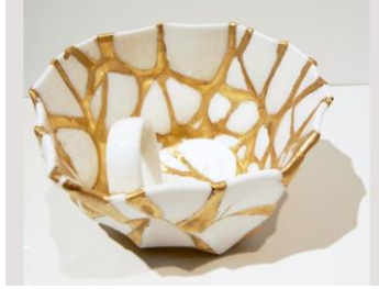
Resim 12: Şeylerin arkasındaki şeyler sergisinden yeniden örgülenen porselen çay fincanı