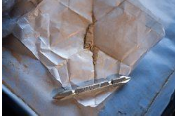
Resim 3: Metalik tozun, parçaları birbirine sabitlemek için reçine veya lake ile karıştırılması işlemi.

Geleneksel kintsugi tekniği, onarım için urushi lak ve gerçek toz altın kullanmayı içerir. Urushi cilası zehirli sarmaşıklerle ilgili bir bitkiden yapılır, bu yüzden onarımları gerçekleştirirken birçok insanda reaksiyona neden olur (bitmiş nesnede kurutulduktan sonra artık reaktif olmamasına rağmen). Bu aynı zamanda altın ile birlikteliğinden kaynaklanan oldukça pahalı bir karışımdır. Kisho - mi urushi ("saf lake") tüm yapıştırma çalışmalarının temelini oluşturur; orijinal seramik parçaları eklemek için kullanılmaktadır. Kisho - mi urushi, en yüksek kalitede ham cila olarak adlandırılmaktadır. Yapıştırma başına, eşit miktarda pirinç yapıştırıcısı ile karıştırılır. Bu karışıma nori urushi (tutkal verniği) adı verilmektedir. Bu malzemenin güçlü bir yapışkan olmasının yanı sıra aynı zamanda oldukça hızlı kuruyan bir özelliği bulunmaktadır.