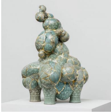
Resim 7: Yeesookyun, Dönüřtürülmüř Vazo, 2012; Kırık Seramikler, Epoxy and 24 karat altın yaprak, 106,68 x 73,66 x 73,66 cm.

iliřkilendirilen güzellik ve saflık görüntüsünde deđildir. Sookyung'sa, her parçayı ayrı bir varlık olarak ele almıř ve parçaları yeniden yapılandırmıřtır (Vancouver Biennale, 2009). Japon geleneđi Kintsugi'den esinlenen Koreli sanatçı kırıkları altınla belirginleřtirmiřtir.