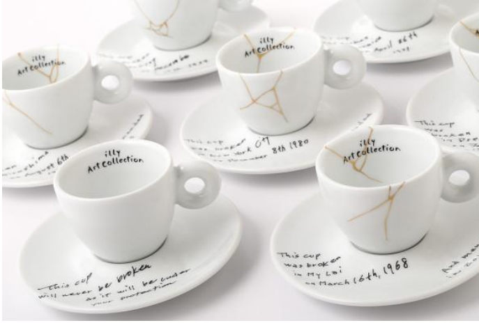
Resim 10: Yoko Ono- kırılmayan porselen fincanlar çalışması

Eski Japon sanatı metaforunu kullanan sanatçı, altın fırça vuruşlarını kullanarak kırık ya da çatlak seramikler gibi görünen koleksiyonunu kintsugi tekniğinden esinlenerek yapmıştır. Ono; eserinde, dünyanın kırılğanlığını ancak buna karşın hep bir umut olduğunu ve bunun da bize bağlı olduğunu sorgulatmıştır (İmaginepeace, 2017).