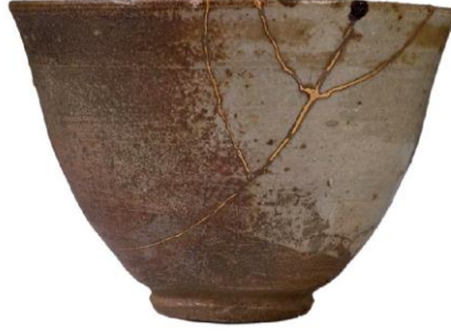
Resim 1: aykasesi, 16.yüzyıl Karatsu Dönemi

Kintsugi; Japonca “altın dođrama” demek olup, saf altın gibi görünmesi amacıyla reçine ile kırık seramikleri onarma sanatı için kullanılan bir terimdir. Kintsugi ile onarılan bir kabın kırılmadan önceki halinden daha değerli ve řaşalı (Ađatekin, 2016) kabul edildiđi bilinmektedir. 17. yüzyıla kadar, kintsugi o kadar popülerleřmiştir ki bazı kiřilerin ay kâselerini altınla onartmak amacıyla kasten kırdıkları bile söylenmiştir. Japonlar sağlam olmayan, hasarlı nesnelere oldukça ilgi göstermiş, bu konuda “wabisabi” řeklinde estetik bir felsefe dahi geliřtirmişlerdir (Lippke, 2010: D1). Kırık bir ay kasesini onarma fikri, Batı'nın mükemmellik ve simetri değerlerinin aksine dođu felsefesi olan wabi-sabi'nin, hasarlı veya kusurlu güzelliđi keřfettiđi fikrin bir uzantısıdır. İşlem aynı zamanda "altın onarım" anlamına gelen "kintsukuroi" olarak da bilinir.