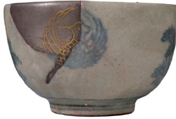
Resim 2: ay kasesi, 18. yüzyıl, Kihara Dönemi

Kintsugi; Japonca “altın dođrama” demek olup, saf altın gibi görünmesi amacıyla reçine ile kırık seramikleri onarma sanatı için kullanılan bir terimdir. Kintsugi ile onarılan bir kabın kırılmadan önceki halinden daha değerli ve řaşalı (Ađatekin, 2016) kabul edildiđi bilinmektedir. 17. yüzyıla kadar, kintsugi o kadar popülerleřmiştir ki bazı kiřilerin ay kâselerini altınla onartmak amacıyla kasten kırdıkları bile söylenmiştir. Japonlar sağlam olmayan, hasarlı nesnelere oldukça ilgi göstermiş, bu konuda “wabisabi” řeklinde estetik bir felsefe dahi geliřtirmişlerdir (Lippke, 2010: D1). Kırık bir ay kasesini onarma fikri, Batı'nın mükemmellik ve simetri değerlerinin aksine dođu felsefesi olan wabi-sabi'nin, hasarlı veya kusurlu güzelliđi keřfettiđi fikrin bir uzantısıdır. İşlem aynı zamanda "altın onarım" anlamına gelen "kintsukuroi" olarak da bilinir.