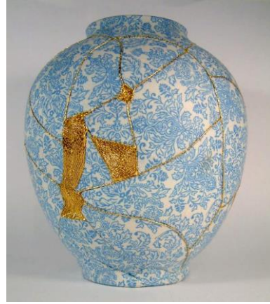
Resim 13: Charlotte Bailey- vazo