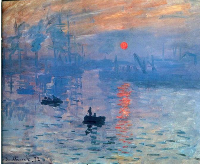
Tablo 1. Claude Monet, “İzlenim: Gün doğumu”, 1873.

akımının adı, Monet'in yaptığı İzlenim: Gün Doğumu (1872) adlı tablosundan gelmektedir (Şişman, 2011: 148). Bu resim, olguculuk akımının ortaya koyduğu düşüncede olduğu gibi; resimsel gerçekliği anlık duyuların tuvale aktarılması biçiminde bizlere duyumsatmaktadır.