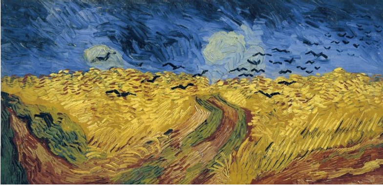
Tablo 3. Vincent van Gogh, "Buğday Tarlası ve Kargalar", 1890.

Resimde asıl olarak acılarla ve buhranlarla dolu bir dünyada savunma yolları arayan ve her şeye rağmen yaşamına devam eden bir kişi betimlenmektedir. Resimde kendisini betimleyen ressam yaşam ile olan savaşımını göstermeye çalışmaktadır.