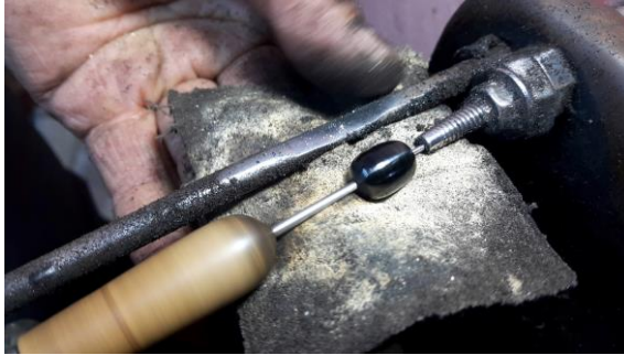
Fotoğraf 6. Tebeşir tozu sürülmüş şayak bezi ile Oltu taşının parlatılması