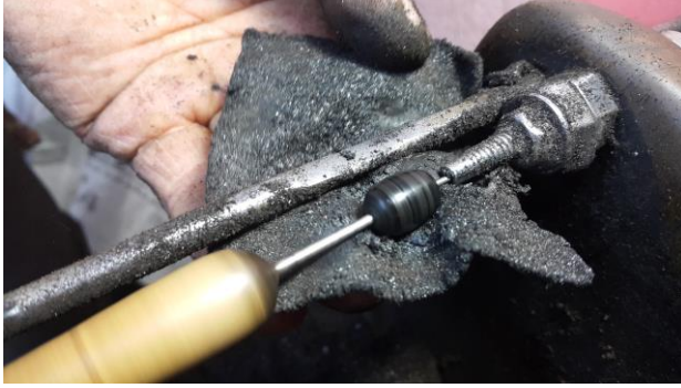
Fotoğraf 5. Kömür tozu sürülmüş şayak bezi ile tanedeki bıçak çiziklerinin kaybedilmesi