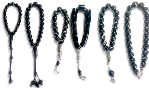
Fotoğraf 2. Tespih ustası İsrail Gümüş tarafından yapılmış Oltu taşı tespihler

Türk kültürü içerisinde, Türklerin kendi zevk ve inceliğinin ortaya konduğu birçok sanat dalı vardır. Türkler sadece yaşadıkları mekânları, okuyup yazdıkları kitapları süslemekle kalmamış, kullandıkları aletlere kadar bir estetik kaygı içerisinde olmuşlar, her malzemeye bir kimlik kazandırmaya çalışmışlardır. Bunun en güzel örneklerinden biri de “tespih” tir. (Karadaş, 2005: 37). Yörede yapılan incelemelerde Oltu taşı işlemeciliği ve çeşitli kuyumculuk tekniklerinin uygulanmasıyla elde edilen hediyeliklerin başında da tespih gelmektedir (Fotoğraf 2).